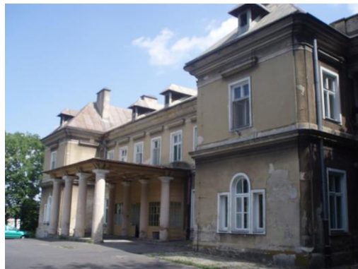
Fotografia 20. Widok na Pałac Jędrzejowiczów [18].