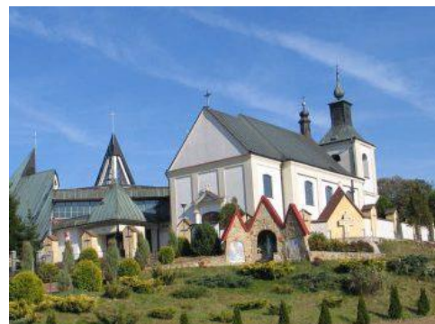
Fotografia 10. Widok na Kościół pw. Św. Mikołaja [9].

Kościół ujęty w Gminnej Ewidencji Zabytków Miasta Rzeszowa.