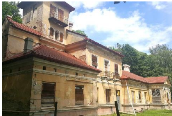
Fotografia 22. Widok na dwór w zespole dworsko – parkowo – folwarczny [4].

Dwór, wybudowany w 1 poł. XIX w. i przebudowany w 3 ćw. XIX w., jest rozłożystym murowanym budynkiem na planie wydłużonego prostokąta o stopniowanym zróżnicowaniu tworzących go brył (od najniższej do najwyższej). Wsch. część, parterowa, kryta jest wysokim trzypołaciowym dachem, z portykiem w elewacji pld. Do niej dobudowana jest część piętrowa, kryta dachem dwuspadowym. Od zach. dostawiona została wieża przykryta niskim dachem namiotowym. Elewacje dworu, ozdobione skromnym detalem architektonicznym (bonia, belkowanie, opaski okienne, gzymsy), wzbogacone zostały bogatymi dekoracjami sztukatorskimi (m.in. rozety we fryzie belkowania). Akcent położono na portyk, gdzie umieszczono płaskorzeźbione hermy z popiersiami kobiet i mężczyzn, rozbudowane belkowanie oraz dekorację tympanonu. Kształt kominów przypomina średniowieczny krenelaż. We wnętrzu budynku zachowały się elementy zabytkowego wyposażenia m.in. piec kaflowy, kominek, parkiety [22].