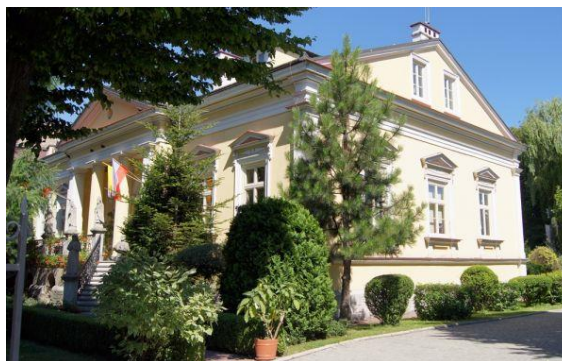
Fotografia 19. Widok na Dworek Karpińskiego [17].

Wybudowany w 1876 rok, powtarza stylistykę pałacyku Burgallera. Zaprojektowany przez Józefa Kwiatkowskiego dla Antoniego Karpińskiego. Dworek wybudowany jako budynek parterowy na wysokich suterynach z charakterystycznym wgłębnym portykiem (dwupółfilarowym i dwukolumnowym) zwieńczonym trójkątnym frontonem. Elewacje ramowane półfilarami, zwieńczone belkowaniem. Otwory okienne ozdobione opaskami i trójkątnymi naczółkami [22].