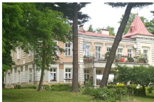
Fotografia 21. Widok na Dworek Władysława Jędrzejowicza [4].

Obecnie jest to piętrowy dwór z umieszczoną w pld. - wsch. narożniku wieżą. W elewacji pld. dostawiono kolumnowy zadaszony taras. Elewacje otrzymały dekorację w postaci boniowanych naroży, opasek okiennych i profilowanych nadproży otworów okiennych oraz gzymsu koronującego [22].