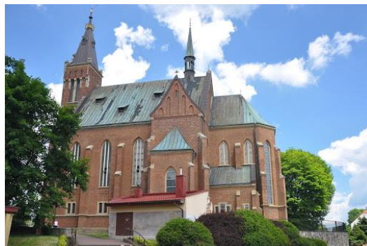
Fotografia 7. Widok na Kościół pw. św. Józefa [7].

Znacznie rozczłonkowany budynek na rzucie krzyża łacińskiego, trójnawowy, trójprzęsłowy z transeptem o ramionach zakończonych prostokątnymi kaplicami. Prezbiterium dwuprzęsłowe zamknięte trójbocznie, z zakrystią od płd. i składzikiem z przedsionkiem - od płn. Kruchta zach. z dwoma mniejszymi przedsionkami po bokach. Kościół o strzelistej bryle z dominującą nad korpusem wysoką, trójkondygnacyjną wieżą. Elewacje z uskokowymi szkarpami, zwieńczone są profilowanym gzymsem [22].