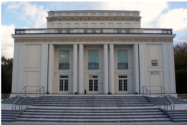
Fotografia 27. Widok na Dom kultury WSK [19].

Budynek dwukondygnacyjny z trójkondygnacyjną częścią środkową mieszczącą salę widowiskową. Trójosiowa fasada z osią zaakcentowaną rodzajem trójosiowego wgłębnego portyku z kolumnami wielkiego porządku. Pomiedzy kolumnami troje drzwi wejściowych, wyżej - duże prostokątne okna z metalowymi balustradami. W osiach skrajnych elewacji prostokątne płyciny flankowane pilastrami. Elewacje zwieńczone są belkowaniem i malowanym fryzem o motywach kwiatowych i profilowanym gzymsem wieńczącym. Ponad gzymsem balustrada obiegająca całość budynku. We wnętrzu, po generalnym remoncie, częściowo zachowano pierwotny wystrój z lat 50. XX w., a częściowo z lat 60. XX w. [22].