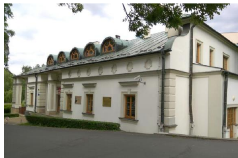
Fotografia 23. Widok na Dwór przy ul. Ćwiklińskiej 1 [4].

Dwór i pozostałości parku wpisane są do rejestru zabytków pod nr A-1007 z dn. 11.10.1978 r.