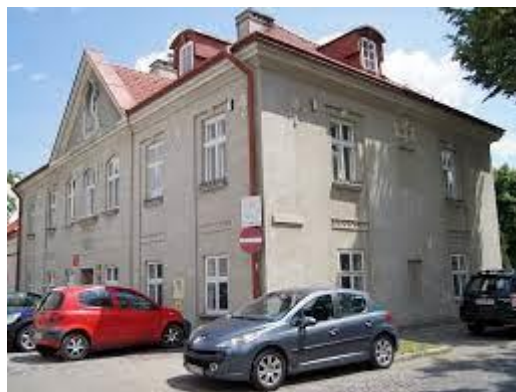
Fotografia 16. Widok na Dworek Piątkowskiego [15].