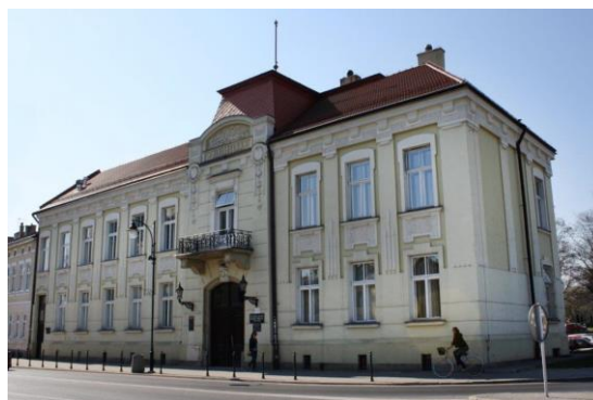
Fotografia 25. Widok na budynek Wojewódzkiej i Miejskiej Biblioteki Publicznej [20].

Budynek wzniesiony został w latach 1889 - 1904 wg proj. Tadeusza Stryjeńskiego. Wolnostojąca, dwukondygnacyjna budowla z wysokim czterospadowym dachem złożona jest z korpusu frontowego oraz węższego i krótszego traktu tylnego, mieszczącego klatki schodowe. Osie dwóch symetrycznych elewacji akcentuje ryzalit. Ryzalit frontowy, z balkonem na piętrze wspartym na kamiennych kroksztynach, ozdobiony został kampanulami i zwieńczony segmentowym naczółkiem. W elewacji przeważa pionowa artykulacja pilastrami wyrastającymi z poziomo boniowanego cokołu. Całość wieńczy fryz i gzyms. Uwagę zwraca też płycinowa dekoracja wnętrza z oszczędnym secesyjnym ornamentem [22].