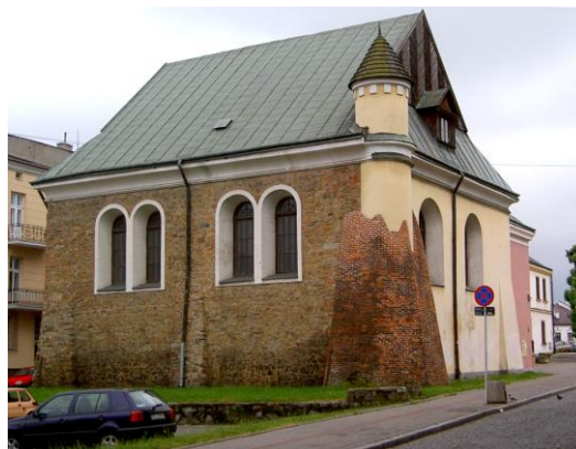
Fotografia 13. Widok na Synagogę Staromiejską [12].

Budynek wpisany jest do rejestru zabytków pod nr A-646 z dn. 25.03.1987 r.