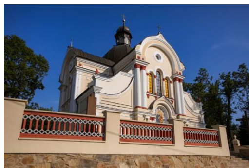
Fotografia 12. Widok na Cerkiew greckokatolicka ob. kościół rzymskokatolicki pw. Wniebowzięcia NMP [11].