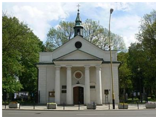
Fotografia 5. Widok na Kościół pw. św. Trójcy [5].

Kościół pw. św. Trójcy wzniesiony przed 1745 r. z fundacji księcia Jerzego Ignacego Lubomirskiego, jako kościół szpitalny. Kościół św. Trójcy spłonął w 1763 r. lub w 1779 r. i w latach 1787 - 1792 został odbudowany za Franciszka Lubomirskiego, zapewne na fundamentach poprzedniego kościoła i być może z wykorzystaniem części jego murów. Powstał już, jako kaplica cmentarna pw. Św. Trójcy, w związku z przeniesieniem cmentarza parafialnego spod kościoła farnego. Wiązało się to z zakazem pochówków na cmentarzach przykościelnych w obrębie miast. Na terenie byłego ogrodu szpitalnego wyznaczono obszar cmentarza [22].