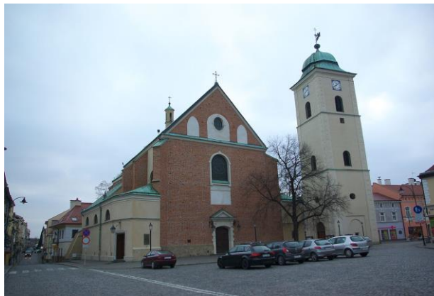
Fotografia 1. Widok na Kościół parafialny pw. św. Stanisława i św. Wojciecha [1].

Kościół orinietowany. Jest to świątynia salowa o prostokątnym, trójnawowym korpusie i niższym, wydłużonym prezbiterium zamkniętym trójbocznie, nakryta dwuspadowymi dachami i dachami pulpityowymi - nawy boczne. Nawy nakryte sklepieniami kolebkowymi i krzyżowymi, rozdzielone są masywnymi filarami. Budynek oszkarpowany. Ściany korpusu ceglane, częściowo tynkowane. Zastosowany przy rozbudowie system ściennie - filarowy, kolebkowe i krzyżowe sklepienia, półkoliste okna posiadają cechy barokowe, lecz brak wyraźnych cech stylistycznych nie pozwala na dokładniejsze datowanie [22].