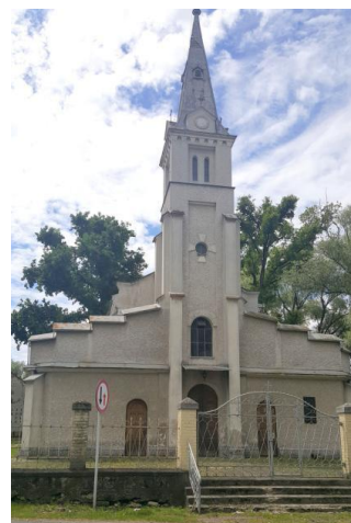
Fotografia 9. Widok na Kościół pw. Matki Bożej Śnieżnej [4].

Kościół objęty ochroną poprzez wpis do rejestru zabytków pod nr A-191 z dn. 26.02.2007 r.