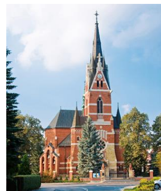
Fotografia 8. Widok na Kościół pw. Św. Marcina i Św. Rocha [8].

Kościół neogotycki, murowany z cegły z użyciem kamienia, wzniesiony został na planie krzyża łacińskiego, jako trójnawowy z transeptem. Węższe prezbiterium zamknięte jest trójbocznie, po bokach przylegają zakrystia i składzik. Od frontu kwadratowa w rzucie wieża flankowana dwoma wieżyczkami schodowymi. Elewacje ceglane z elementami z piaskowca, oszkarpowane masywnymi szkarpami. Wieża, do wysokości drugiej kondygnacji, z kamienia. Otwory okienne w większości ostrołukowe, w wieży duża rozeta z kamiennym maswerkiem. Świątynię na przełomie lat 20. i 30. XX w. ozdobił polichromią autorstwa malarzy Jerzego Makarewicza i Jana Bukowskiego [22].