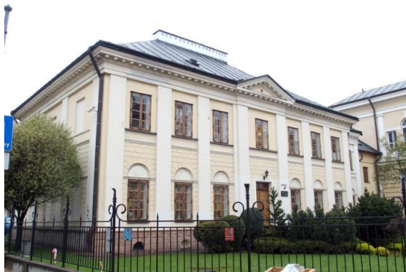
Fotografia 18. Widok na Pałacyk Burgallera [4].

Pałacyk Burgallera (l. 1818 - 1823, 1910 r.) to klasycystyczny budynek, wybudowany najprawdopodobniej przez budowniczego Burgallera, swoim usytuowaniem przeciął oś planistyczną zamek - fara. Jest to obiekt piętrowy o wyważonych proporcjach, kryty wysokim czterospadowym dachem. Jego elewacje zostały podzielone lizenami w wielkim porządku, parter ozdobiony boniowaniem, a półkoliste płyciny nad oknami parteru pokryte zostały ornamentem palmetowym. Całość zwieńczona jest pełnym belkowaniem. Na osi elewacji frontowej pseudoryzalit z wejściem, zwieńczony niewielkim tympanonem [22].