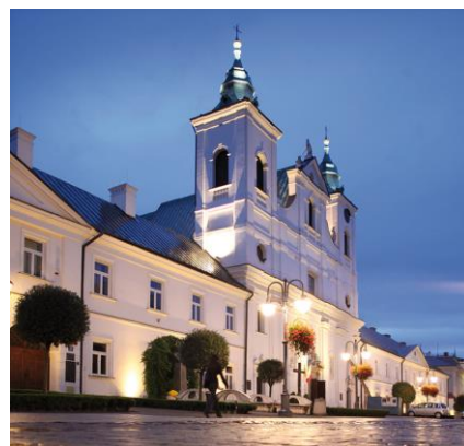
Fotografia 3. Zespół kościelno - klasztorny oo. Pijarów [3].

Symetrycznie usytuowane w stosunku do kościoła budynki kolegium i klasztoru, o skromnych, jednorodnych elewacjach akcentowanych trójosiowymi ryzalitami, czynią z kościoła dominantę i centrum kompozycji.