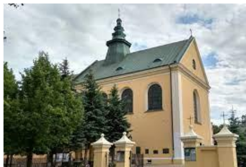
Fotografia 4. Widok na Kościół oo. Reformatów pw. Narodzenia Panny Marii [4].

W 1722 r. poświęcono istniejący do dzisiaj kościół. Projekt założenia przypisywany jest Janowi Chrzycielowi Belottiemu. Po I rozbiórce Polski nastąpiła kasata klasztoru, zakonników przeniesiono do innych klasztorów, budynek zamieniono na więzienie, następnie na szpital wojskowy, a w 1 poł. XIX w. rozebrano. Kościół przez cały okres rozbiorów pełnił funkcję magazynów, a ogród klasztorny w 1871 r. przekształcono w ogród miejski [22].