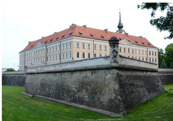
Fotografia 14. Widok na zamek Lubomirskich [13].

Budynek zamku został rozebrany, a nowy wybudowano praktycznie od podstaw, z wyjątkiem wieży. Całość prac zakończono w 1905 r., w listopadzie sąd zaczął już pracować w nowym budynku. W wyniku prac powstał czteroskrzydłowy, dwupiętrowy gmach sądowy. Elewacje skrzydeł zostały rozbite umieszczonymi na osi ryzalitami zwieńczonymi niewielkimi trójkątnymi szczytami. Dodatkowo elewacje dekorowano boniowaniem. Istniejącą w elewacji frontowej wieżę podwyższono i zwieńczono neobarokowym hełmem. Całość nawiązuje do widoku zamku z planu Wiedemanna. Fortyfikacje zostały pozbawione wałów ziemnych, odrestaurowane, zniesiono przedpiersie, które w późniejszym czasie wymurowano na nowo. Do czasów obecnych rzeszowski zamek Lubomirskich jest siedzibą Sądu Okręgowego [22].