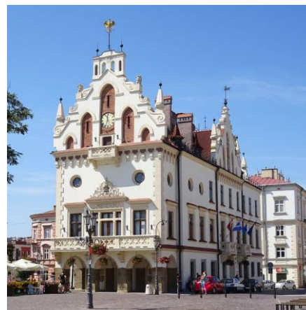
Fotografia 24. Widok na Ratusz w Rzeszowie [19].

Ratusz wpisany jest do rejestru zabytków pod nr A-1040 z dn. 31.12.1993 r.