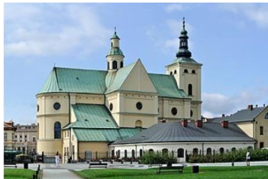
Fotografia 2. Klasztor i kościół oo. Bernardynów pw. Wniebowzięcia NMP [2].

Kościół orientowany. Wzniesiony został na rzucie krzyża łacińskiego. Skrzyżowanie dwuprzęsłowej nawy głównej i transeptu nakryte jest kopułą ukrytą w przestrzeni dachu, z zewnętrznym akcentem w formie dwukondygnacyjnej latarni. Prezbiterium zamknięte półkoliście, wysokością i szerokością równe jest nawie. W fasadzie - pięciokondygnacyjna wieża zwieńczona hełmem z ażurową latarnią. Elewacje tynkowane, ujednolicone gzymsami kordonowymi i gzymsem wieńczącym, rozcłunkowane pilastrami i podziałami ramowymi. Otwory okienne zamknięte łukiem okrągłym oraz tonda. Nawę poprzeczną tworzy obecnie para kaplic otwartych do wnętrza, płasko sklepionych, równych wysokością całemu wnętrzu kościoła [22].