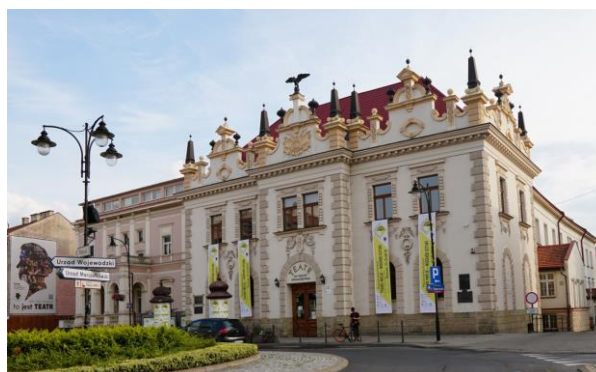
Fotografia 26. Widok na Teatr im. Wandy Siemaszkowej ul. Sokoła 9 [19].