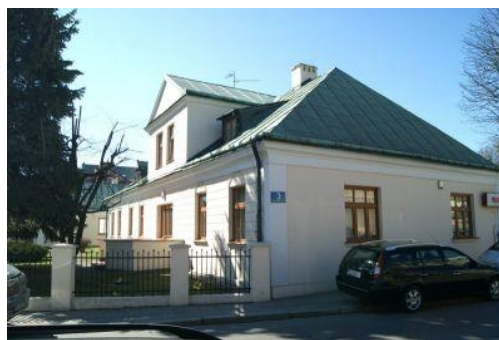
Fotografia 17. Widok na Dworek Skrzyńskich [16].

Dworek Skrzyńskich (1 ćw. XIX w., 1928 - 1930) zachował swoją historyczną bryłę. Jest to rozłożysty parterowy budynek, kryty wysokim czterospadowym dachem z facjatą w elewacji płd. Dworek ozdobiony skromnym wystrojem architektonicznym - pasowa dekoracja ścian, nad otworami okiennymi półkoliste płyciny z dekoracją palmetową, toskańska kolumna przy wejściu. W zespole dworku jest także oficyna (1 ćw. XIX w.) położona na zach. od głównego budynku [22].