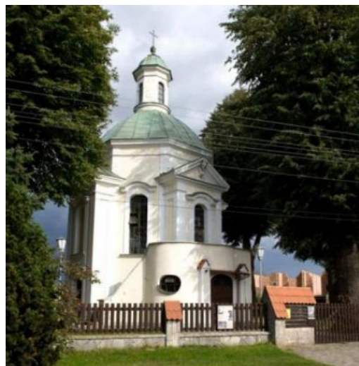
Fotografia 11. Widok na kaplicę myśliwską pw. Św. Huberta [10].

Cerkiew objęta ochroną poprzez wpis jest do rejestru zabytków pod nr A-67 z dn. 27.01.2003 r.