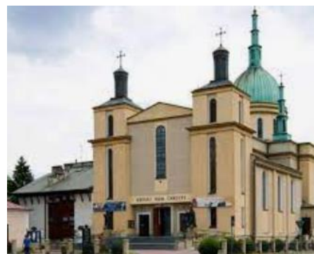
Fotografia 6. Widok na Kościół paraf. pw. Chrystusa Króla [6].

W 1933 r. zakończono budowę murów. W 1935 r. rozpoczęto urządzenie wnętrza kościoła. W 1936 r. biskup F. Barda mianował ks. J. Jałowego rektorem kościoła i zezwolił na odprawienie pierwszych mszy św., jednak uroczystej konsekracji świątyni dokonano w 1937 r. W 1941 r. został zajęty przez Niemców, a w 1942 r. całkowicie zamknięty. W czasie wojny uległ częściowo zniszczeniu (m.in. uszkodzony dach i witraże). Po remoncie w 1948 r. ustanowiono parafią [22].