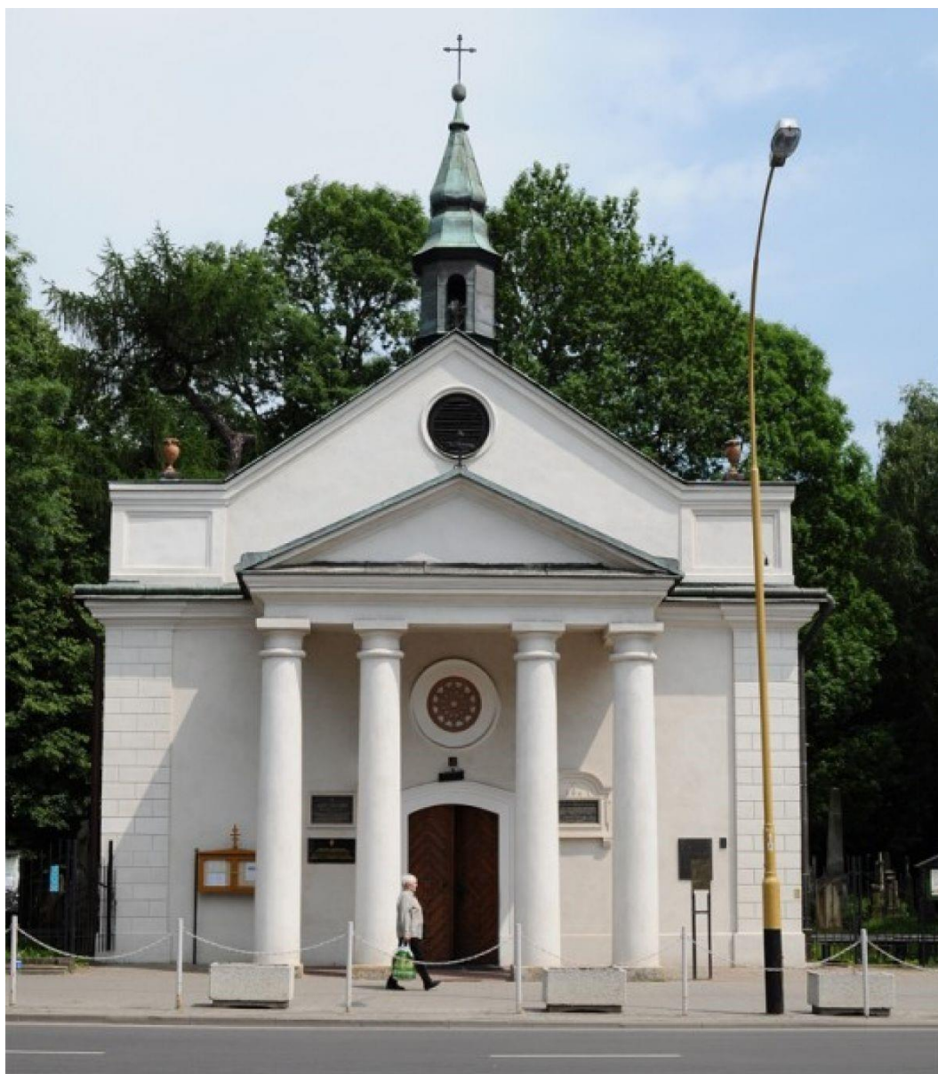
Zdjęcie 7 Cerkiew grekokatolicka, dawny Kościół św. Trójcy, przy której w latach 2021-2022 kontynuowane były prace remontowo-konserwatorskie dotowane z budżetu Gminy Miasto Rzeszów, Podkarpackiego Wojewódzkiego Konserwatora Zabytków i Województwa Podkarpackiego.

W 2022 r. udzielona została zaś jedna dotacja: w wysokości 30 000 zł dla Parafii greckokatolickiej pw. Zaśnięcia Najświętszej Marii Panny w Rzeszowie na prace remontowo-konserwatorskie przy fundamentach, ścianach i sklepieniu cerkwi.