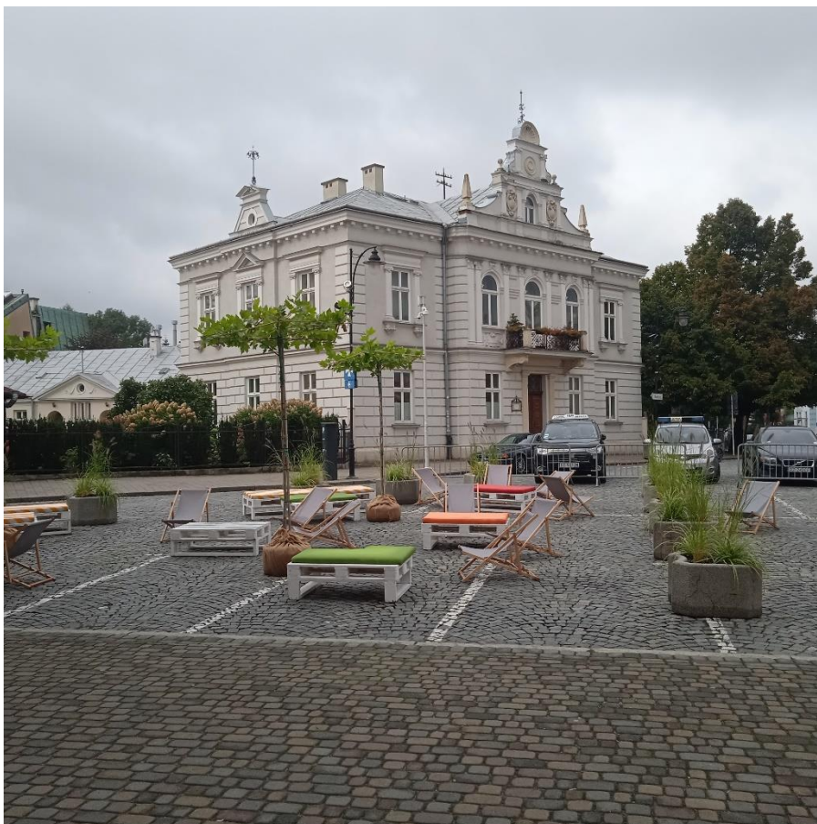
Zdjęcie 2 Plac Farny wyłączony z ruchu kołowego w ramach działań o charakterze próbnym i tymczasowym we wrześniu 2022 r.

W okresie sprawozdawczym prowadzone były również działania zmierzające do ograniczenia ruchu kołowego w zabytkowym centrum miasta. W lipcu 2021 r. prezydent Miasta Rzeszowa wydał zakaz parkowania pojazdów przy Ratuszu, natomiast we wrześniu tego samego roku wyłączył z ruchu kołowego część ul. Jagiellońskiej przy skrzyżowaniu z ul. 3 Maja. Było to działanie próbne o charakterze tymczasowym, poprzedzone konsultacjami społecznymi z mieszkańcami. We wrześniu kolejnego roku działanie powtórzono na Placu Farnym. Wyłączone z ruchu kołowego nawierzchnie zaaranżowano obiektami małej architektury typu parlety.