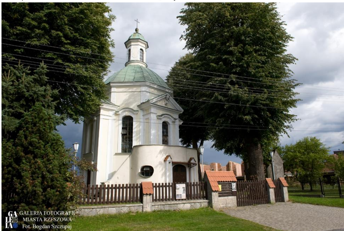
Zdjęcie 6 Kaplica myśliwska pw. Św. Huberta w Rzeszowie-Miłocinie, przy której w latach 2021-2022 kontynuowane były prace remontowo-konserwatorskie dotowane z budżetu Gminy Miasto Rzeszów i Podkarpackiego Wojewódzkiego Konserwatora Zabytków.

Wysokość środków przeznaczonych w budżecie gminy na ochronę zabytków i opiekę nad zabytkami w 2021 r. wyniosła 4 675 452, 12 zł (Uchwała Nr XL/824/2020 Rady Miasta Rzeszowa z dnia 15 grudnia 2020 r. w sprawie budżetu Miasta Rzeszowa na 2021 r. wraz ze zmianami oraz sprawozdanie z wykonania budżetu miasta Rzeszowa za 2021 r.). W 2022 r. na ochronę zabytków i opiekę nad zabytkami Gmina Miasto Rzeszów wydatkowała kwotę 1 443 915, 43 zł (Uchwała Nr LVI/1167/2021 z dnia 14 grudnia 2021 r. w sprawie budżetu Miasta Rzeszowa na 2022 r. wraz ze zmianami oraz sprawozdanie z wykonania budżetu miasta Rzeszowa za 2022 r.) Środki te przeznaczono m.in. na renowację i konserwację zabytkowych nagrobków na Cmentarzu Starym przy ul. Targowej, prace związane z rewaloryzacją zabytkowego parku z zespołu dworsko-parkowego w Rzeszowie-Zalesiu oraz udzielane z budżetu Gminy Miasto Rzeszów dotacje na prace konserwatorskie, restauratorskie i roboty budowlane przy zabytkach wpisanych do rejestru zabytków, położonych na obszarze Gminy Miasto Rzeszów. Powyższe kwoty dotyczą wyłącznie wydatków w ramach rozdziału klasyfikacji budżetowej dedykowanego ochronie zabytków i opiece nad zabytkami. Dodatkowo, z budżetu Miasta Rzeszowa, w ramach innych rozdziałów klasyfikacji budżetowej, finansowane były również inne działania przy zabytkach, m.in. prace remontowo-konserwatorskie zabytków stanowiących własność Gminy Miasto Rzeszów oraz liczne działania „miękkie”.