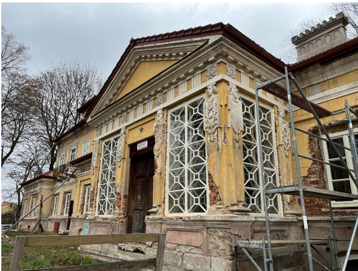
Zdjęcie 8 Dwór Chłapowskich z zespołu dworsko parkowego w Rzeszowie-Słocinie, przy którym w latach 2021-2022 kontynuowane były prace remontowo-konserwatorskie dotowane z budżetu Gminy Miasto Rzeszów i Podkarpackiego Wojewódzkiego Konserwatora Zabytków.