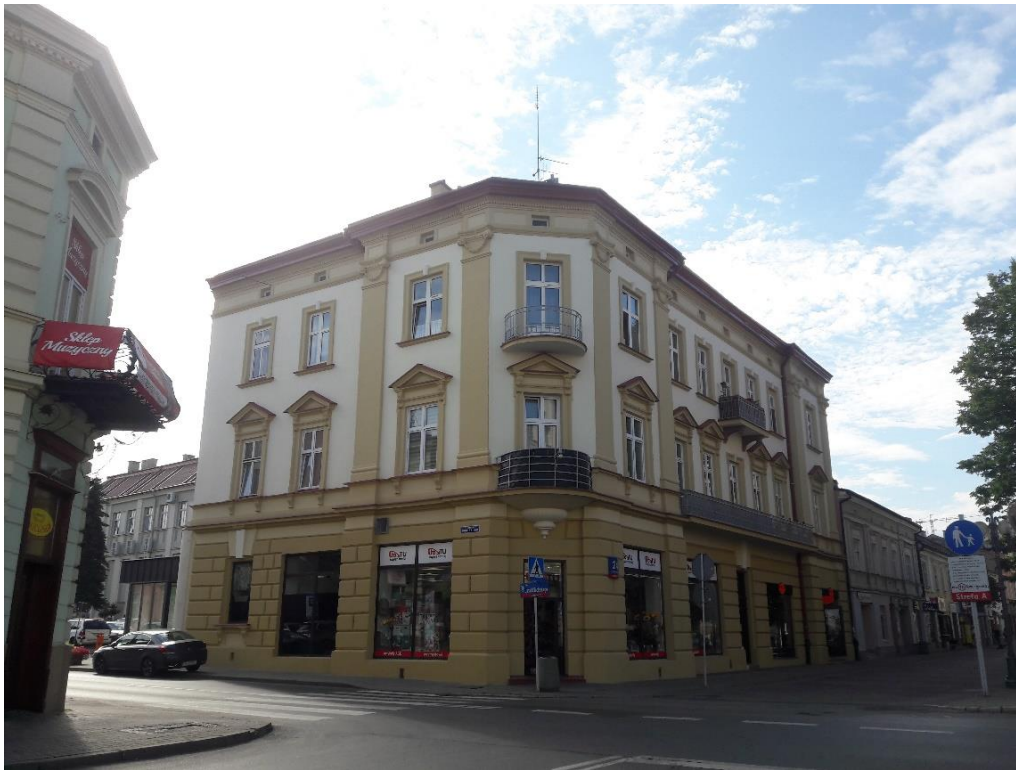
Zdjęcie 4 Kamienica przy ul. Grunwaldzkiej 24, podana pracom remontowo-konserwatorskim w latach 2021-2022, prowadzonym przez MZBM sp. z o.o.

Prace remontowe przyczyniające się do poprawy stanu technicznego i estetycznego budynków zlokalizowanych w śródmieściu Rzeszowa, w tym obiektów zabytkowych, realizowane były również w okresie sprawozdawczym zarówno przez podmioty publiczne, jak i inwestorów prywatnych. Kontynuowane były działania prowadzone systematycznie od wielu lat przez Miejski Zarząd Budynków Mieszkalnych w Rzeszowie w zakresie poprawy stanu zachowania oraz estetyki budynków mieszkalnych oraz obszarów w ich bezpośrednim sąsiedztwie, znajdujących się w zarządzie MZBM. W 2021 r. zrealizowane zostały prace przy 4 obiektach zabytkowych z terenu Miasta Rzeszów, tj. przy ul. Grunwaldzkiej 24, ul. Dąbrowskiego 81, ul. PCK 8, ul. Kreczmera 6. Wartość prac wyniosła łącznie 625 000 zł. W 2022 r. poprawiono natomiast stan techniczny bądź estetyczny 17 budynków zabytkowych, tj. ul. Grunwaldzka 24, ul. Sobieskiego 5, ul. 3 Maja 7, ul. Baldachówka 7, ul. Dąbrowskiego 75C, ul. Dąbrowskiego 85, ul. Dominikańska 6A, ul. Hetmańska 32, ul. Jagiellońska 8, ul. Jałowego 15, ul. Matejki 10, ul. Mickiewicza 17, ul. Słowackiego 8, ul. Westerplatte 3, 5, 7, 9. Wartość prac wyniosła łącznie 588 532 zł.