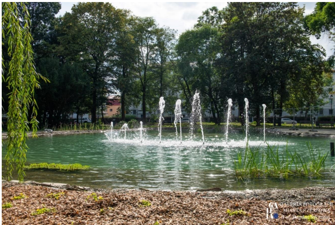
Zdjęcie 5 Ogród Miejski im. Solidarności

Wykonano także remont chodnika i nawierzchni jedni przy ul. Powstańców Śląskich, wchodzącej w skład zabytkowego zespołu dworsko-parkowego w Rzeszowie-Słocinie .