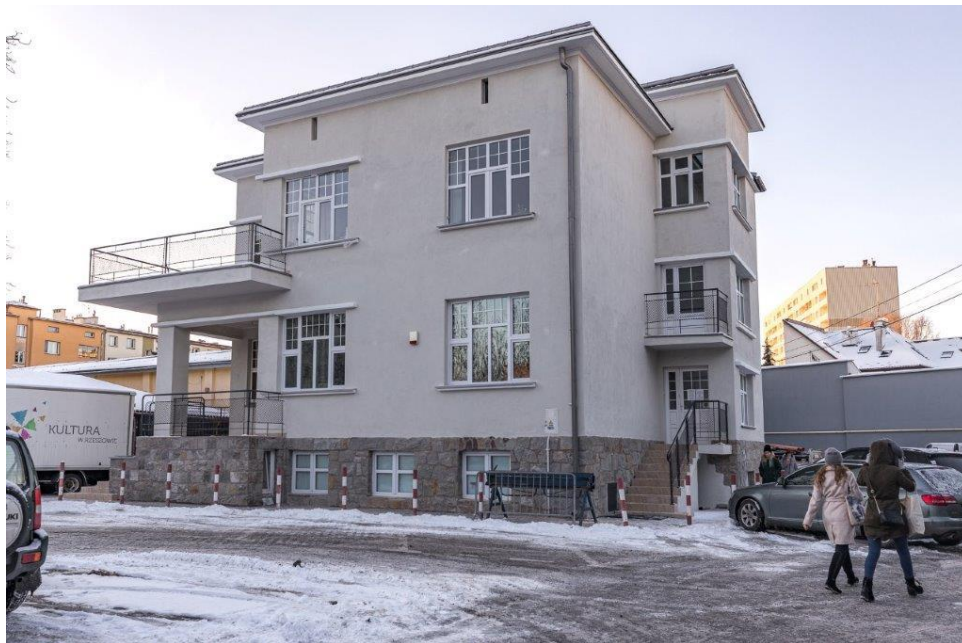
Zdjęcie 3 Kamienica przy ul. Jagiellońskiej 24, dawna Willa Januszów, obecnie siedziba Estrady Rzeszowskiej, podana pracom remontowo-konserwatorskim w 2021 r. (Fot. Estrada Rzeszowska).

historii i kultury 1 . W tabeli poniżej przedstawiono zestawienie działań i prac remontowych przy nieruchomościach zabytkowych (wpisanych do rejestru zabytków, ujętych w gminnej ewidencji zabytków lub znajdujących się na obszarach wpisanych do rejestru zabytków lub ujętych w gminnej ewidencji zabytków), stanowiących własność Gminy Miasto Rzeszów, przeprowadzonych w latach 2021-2022.