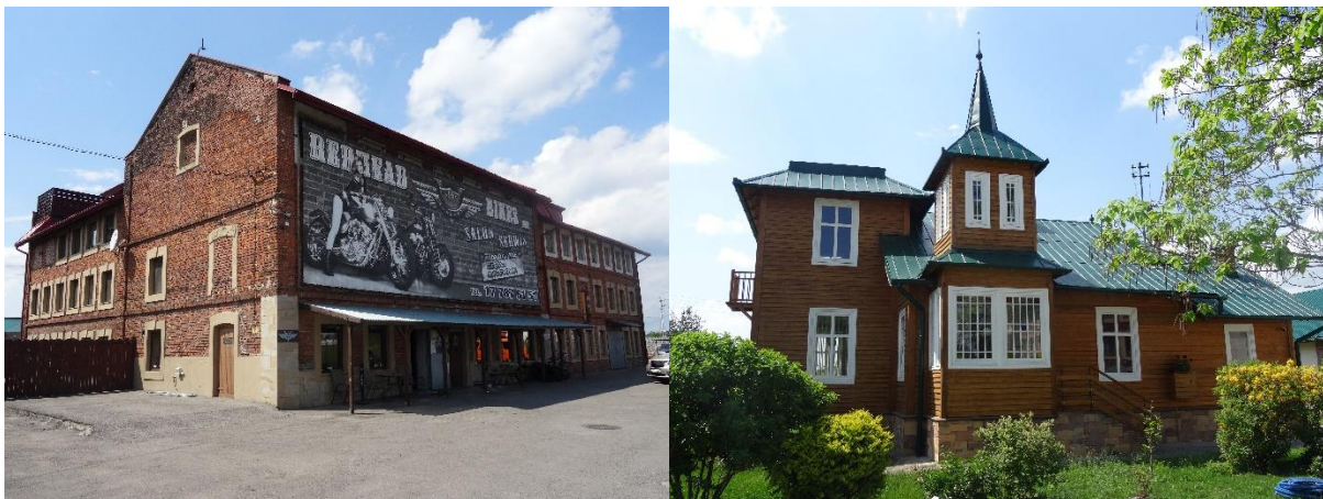
Zdjęcie 1 Młyn oraz dom właściciela młyna z terenu os. Pogwizdów Nowy, obiekty włączone do Gminnej Ewidencji Zabytków Miasta Rzeszowa w 2021 r.

Aktualny wykaz zabytków z terenu Rzeszowa ujętych w gminnej ewidencji zabytków znajduje się na stronie internetowej Biuletynu Informacji Publicznej Miasta Rzeszowa w zakładce „Gminna Ewidencja Zabytków”. Na koniec 2022 r. w wykazie Gminnej Ewidencji Zabytków Miasta Rzeszowa znajdowało się 1382 obiektów zabytkowych , w tym układy urbanistyczne, zespoły obiektów sakralnych, nieruchomości, parki i cmentarze, obiekty kolejowe, kapliczki oraz stanowiska archeologiczne.