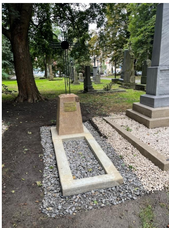
Zdjęcie 9 Po lewej: Nagrobek Józefa Łukasiewicza na Starym Cmentarzu, po prawej: Nagrobek Ludwika Schaittera na Starym Cmentarzu, poddane w latach 2021-2022 pracom konserwatorskim.