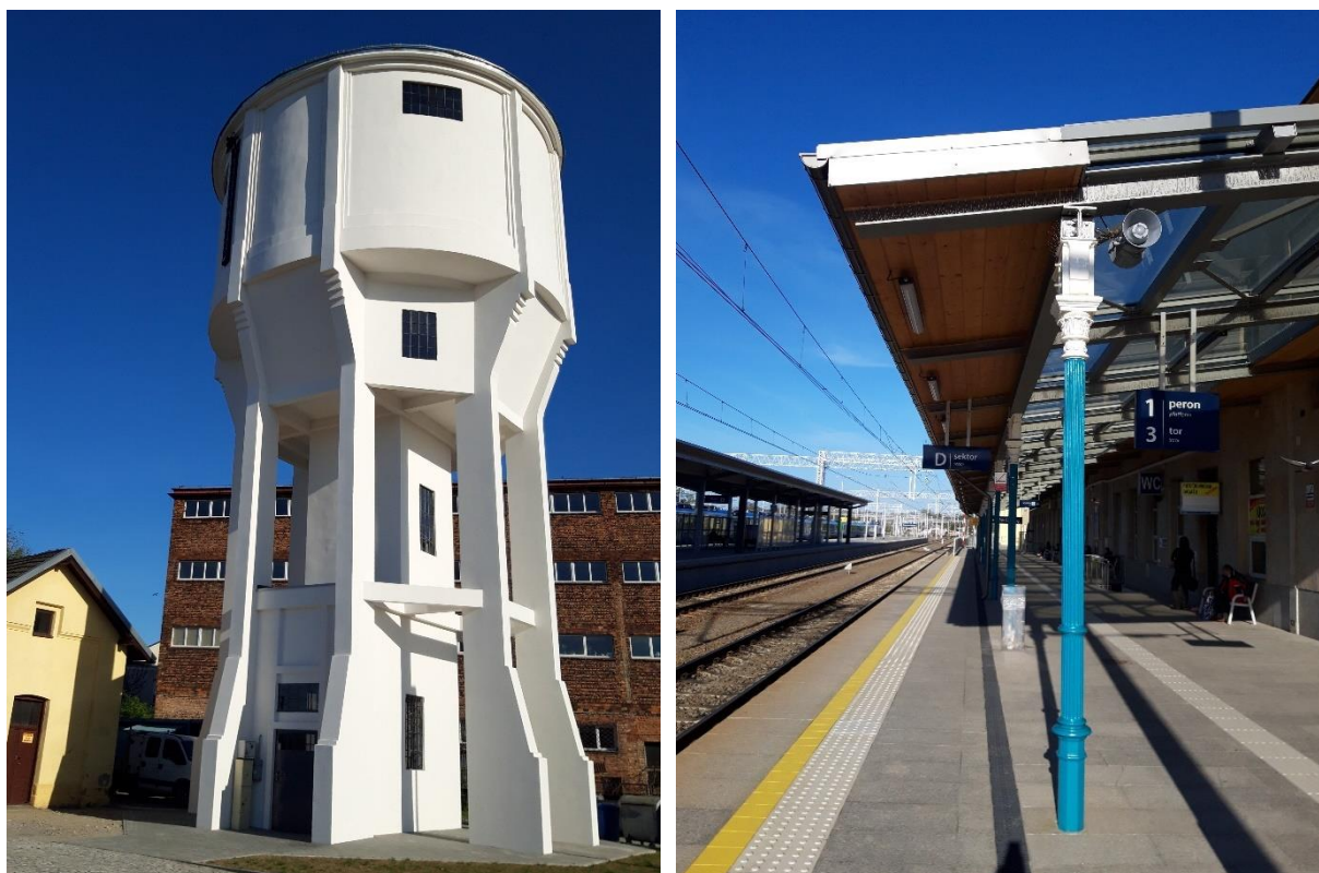
Zdjęcie 10 Wieża wodna oraz żeliwne słupy zadaszania peronu przy budynku dworca

architektury na terenie stacji, a elementy kamienne przyczółków ponownie wykorzystane i wbudowane w nowe przyczółki. Wiata z charakterystycznym zadaszaniem w formie harmonijki, z uwagi na brak technicznych możliwości jej przeniesienia została zrekonstruowana nad nowym wejściem do przejścia podziemnego. Wśród pozostałych działań przy obiektach zabytkowych na uwagę zasługuje remont wieży wodnej, który objął swoim zakresem prace przy zewnętrznych elementach obiektu, tj. elewacjach, ślusarce okiennej i drzwiowej oraz pokryciu dachowym oraz prace remontowo-konserwatorskie zabytkowych żeliwnych słupów (z przywróceniem pierwotnej kolorystyki) w ramach renowacji zadaszania peronów przy budynku dworca kolejowego.