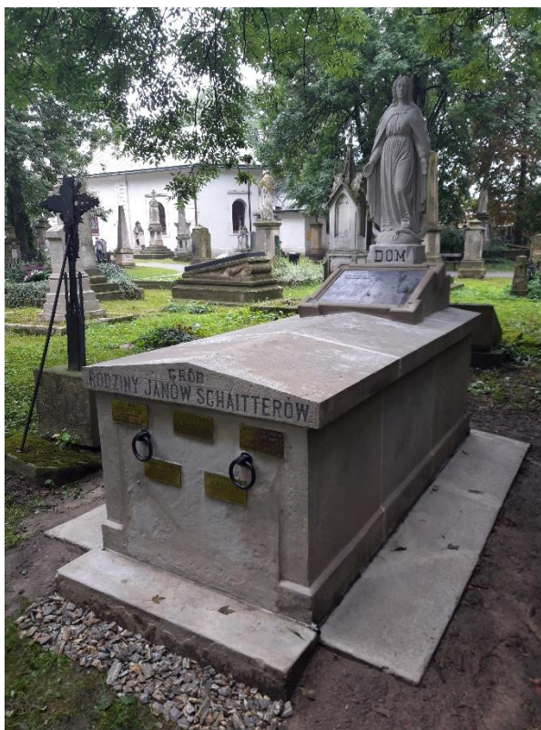
Zdjęcie 8 Po lewej: Kapliczka na skrzyżowaniu ulic Budziwojskiej i Podleśnej, po prawej: Grobowiec Rodziny Schaitterów na Starym Cmentarzu, poddane w latach 2019-2020 pracom konserwatorskim