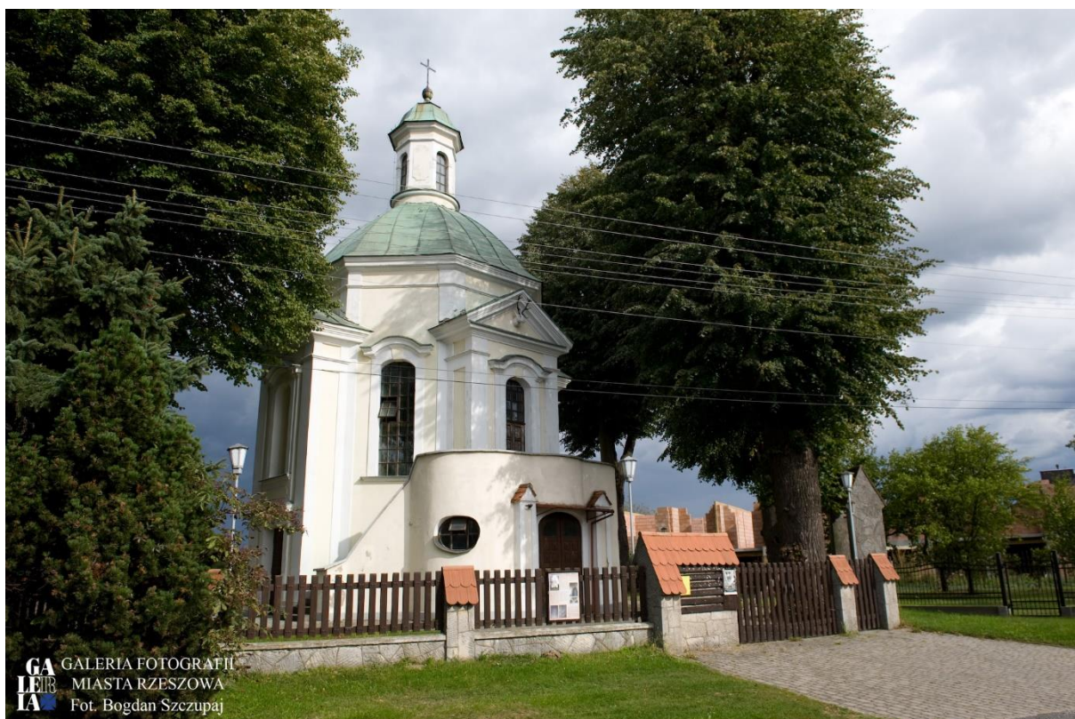
Zdjęcie 2 Kaplica myśliwska pw. Św. Huberta w Rzeszowie-Miłocinie

Na terenie Gminy Miasto Rzeszów znajduje się około 200 obiektów zabytkowych wpisanych do rejestru zabytków nieruchomych województwa podkarpackiego, w tym obiekty nieruchome, układy urbanistyczne oraz stanowiska archeologiczne. Z dniem 1 stycznia 2019 r., w związku z poszerzeniem granic Rzeszowa o obszar sołectw Miłocin oraz Matysówka, w granicach naszego Miasta znalazł się jeden z cenniejszych obiektów architektury sakralnej na Podkarpaciu, powstałym w okresie działań mecenatu Lubomirskich, tj. Kaplica myśliwska pw. Św. Huberta w Rzeszowie-Miłocinie , wpisany do rejestru zabytków decyzją z dnia 11 grudnia 1967 r., pod nr rej. A-962 (d. A-80).