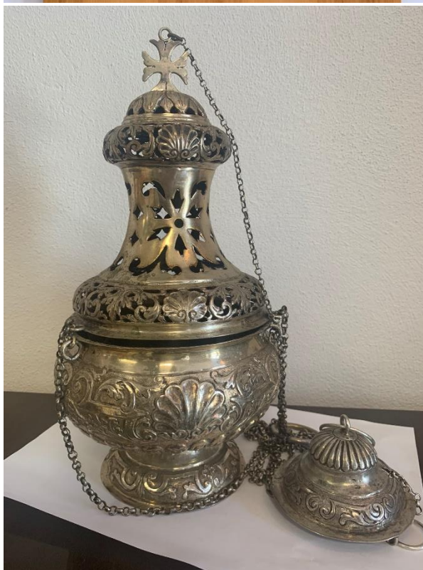
Zdjęcie 4 Elementy wyposażenia Kościoła i Klasztoru OO. Bernardynów w Rzeszowie, wpisane w 2019 r. do rejestru zabytków