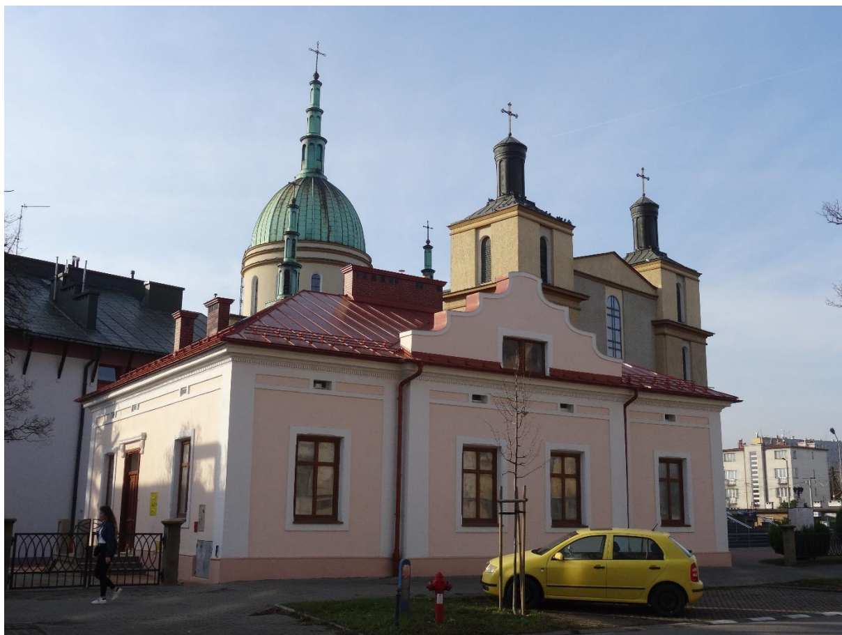
Zdjęcie 6 Dom Parafialny ul. Ks. Jałowego 37 – prace remontowe dotowane w latach 2016-2019 z budżetu Gminy Miasto Rzeszów

Zalesie – parku z zabytkowego założenia dworsko-parkowego Gumińskich w Rzeszowie-Zalesiu, przebudowę instalacji wewnętrznych w obiekcie Podziemnej Trasy Turystycznej oraz tak jak w roku poprzednim na dotacje.