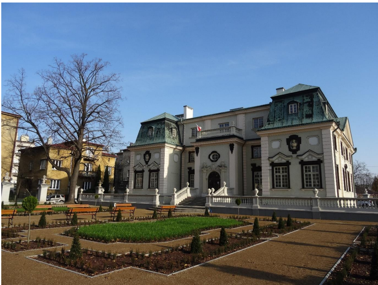
Zdjęcie 9 Odtworzone kwatery przed Letnim Pałacem Lubomirskich