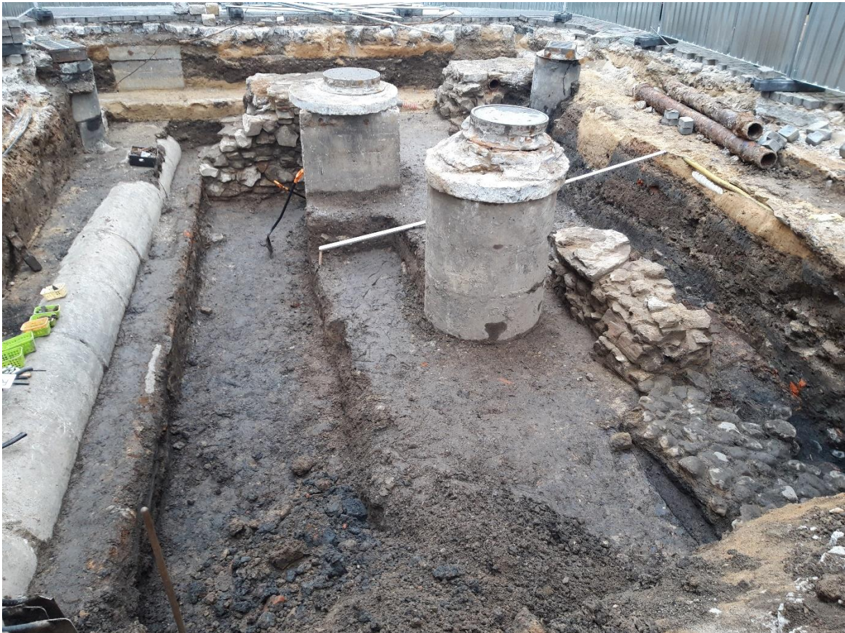
Zdjęcie 9 Ul. Grunwaldzka w trakcie badań archeologicznych w 2020 r.

zakres badań oraz ich wyniki przedstawiono w poprzednim sprawozdaniu z realizacji gminnego programu opieki nad zabytkami, za lata 2017-2018.