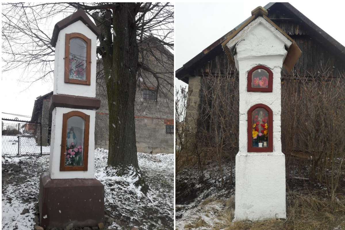
Zdjęcie 5 Kapliczki z terenu os. Matysówka, włączone do Gminnej Ewidencji Zabytków Miasta Rzeszowa w 2019 r.

Wskutek przeprowadzonych aktualizacji w latach 2019-2020 z Gminnej Ewidencji Zabytków Miasta Rzeszowa wyłączonych zostało 6 obiektów , w tym czasie włączono do niej natomiast 16 nowych obiektów zabytkowych .