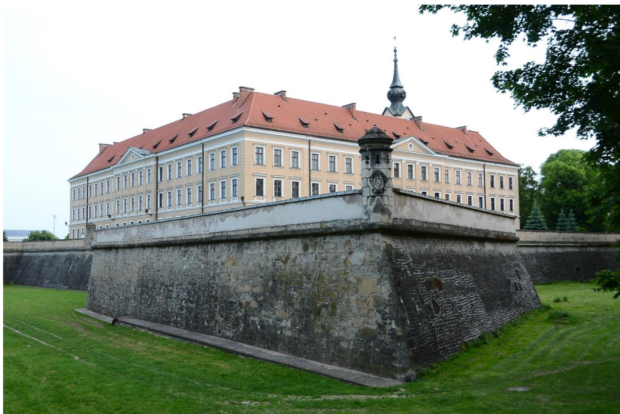
Zdjęcie 11 Zamek Lubomirskich w Rzeszowie

darowizny znalazł się zapis o zabytkowym charakterze nieruchomości, a drugi dotyczy szczegółowego określenia planu zagospodarowania nieruchomości oraz wystąpienia do urzędu konserwatorskiego o sformułowanie zaleceń konserwatorskich dotyczących przyszłego użytkowania. Są to warunki, które Miasto akceptuje i bezwzględnie się do nich dostosuje.