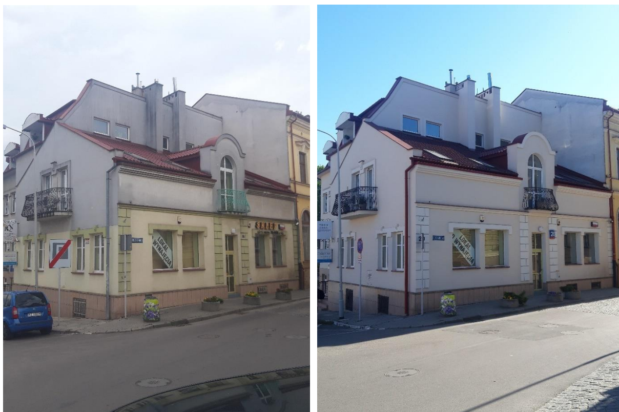
Zdjęcie 10 Kamienica przy ul. Króla Kazimierza 20 nagrodzona w Programie Poprawy Estetyki Miasta Rzeszowa w 2020 r. – zdjęcia przed i po remoncie elewacji

W latach 2019-2020 kontynuowany był również trwający od 2002 roku Program Poprawy Estetyki Miasta Rzeszowa, tj. inicjatywy polegającej na podejmowaniu działań ze strony Urzędu Miasta Rzeszowa mających na celu podnoszenie świadomości wśród właścicieli i zarządców o potrzebie prawidłowego użytkowania i utrzymywania nieruchomości, ze szczególnym uwzględnieniem estetyki elewacji oraz podwórek, bezpośrednio przekładających się na wizerunek miasta. Adresatami Programu Poprawy Estetyki Miasta Rzeszowa są zarówno właściciele obiektów zabytkowych, jak i właściciele nieruchomości znajdujących się w historycznym Śródmieściu Rzeszowa. W ramach tych działań, wzorem lat poprzednich, za pośrednictwem Biura Miejskiego Konserwatora Zabytków organizowane były spotkania z właścicielami obiektów zabytkowych, prowadzono rozmowy oraz korespondencje listowną. W ramach Programu wskazywane i proponowane są prawidłowe rozwiązania oraz udzielane jest wsparcie merytoryczne na etapie realizacji inwestycji.