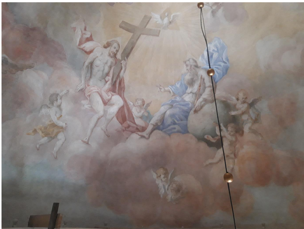
Zdjęcie 3 Fragment polichromii ściennej w Kaplicy pw. Św. Huberta w Rzeszowie-Miłocinie

W związku ze zmianą granic miasta Rzeszowa w 2019 r., na liście zabytków ruchomych wpisanych do rejestru zabytków z terenu Rzeszowa pojawiły się elementy wystroju i wyposażenia – polichromia ścienna i żyrandol z XVIII w. – Kaplicy myśliwskiej pw. Św. Huberta w Rzeszowie-Miłocinie , wpisane do rejestru zabytków decyzją z dnia 7 listopada 2012 r., pod nr rej. B-551.