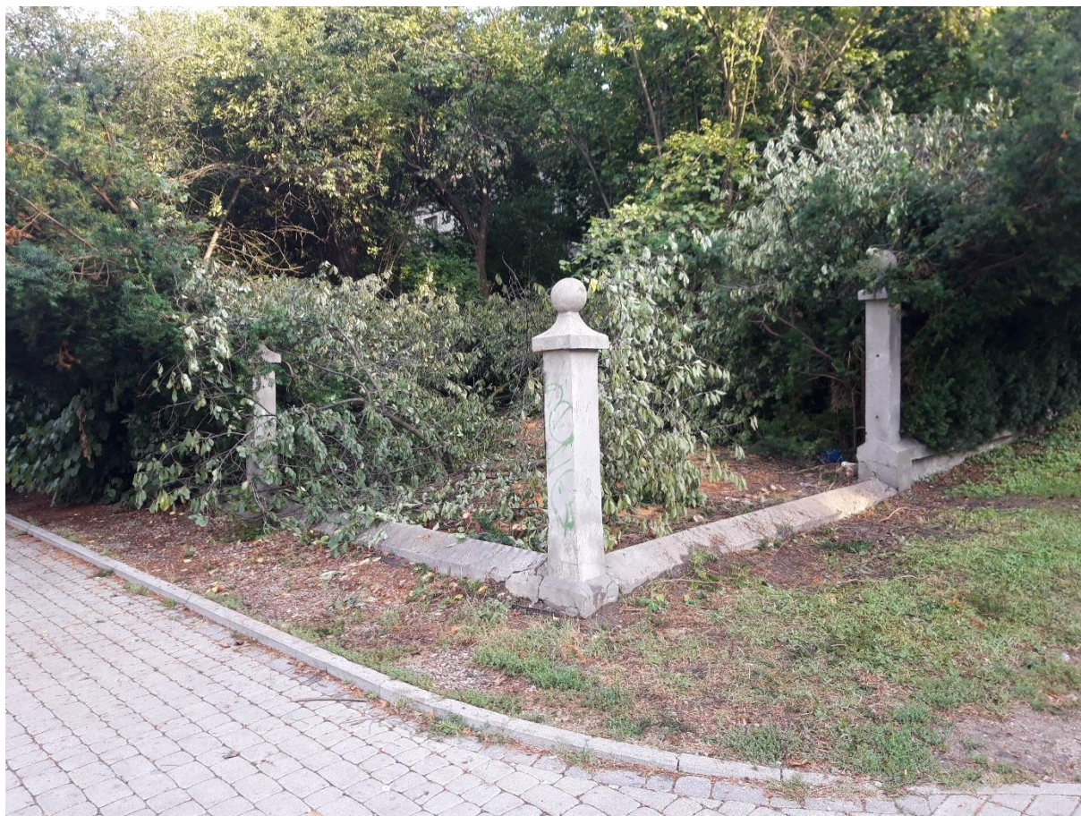
Zdjęcie 1 Ogrodzenie po demontażu dwóch przęseł

powołanego wyżej przepisu wynosił 180 dni od dnia wejścia w życie ustawy, tj. od 8 marca do 5 września 2020 r. W obliczu braku instrumentów prawnych do weryfikacji prawidłowości zastosowania trybu z art. 12 ww. ustawy, tj. stwierdzenia przeciwdziałania COVID-19, działanie inwestorów na podstawie tych przepisów wzbudziło w kraju liczne kontrowersje.