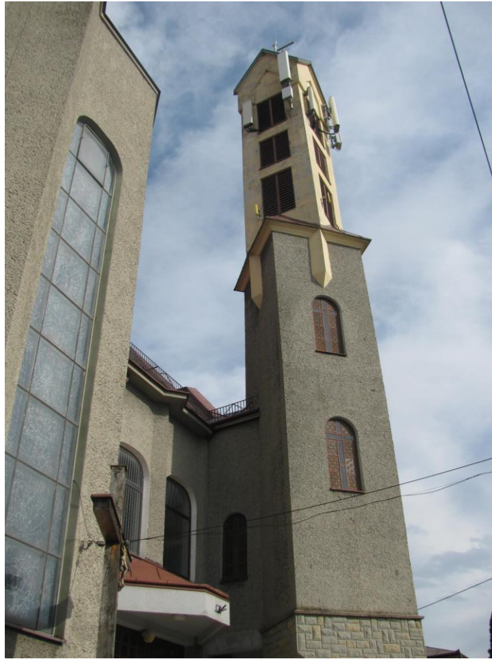
Zaf. nr 1: Widok ogólny instalacji radiokomunikacyjnej.