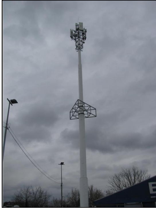
Zaf. nr 1: Widok ogólny instalacji radiokomunikacyjnej.