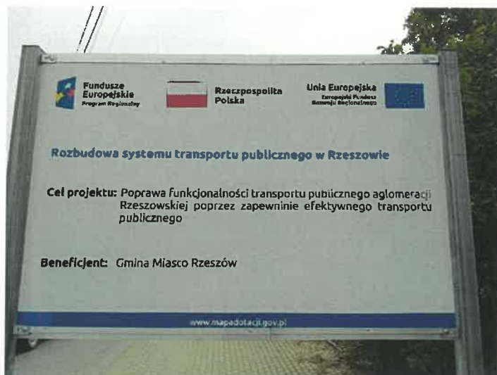
Tablica pamiątkowa ul. Rocha początek I etapu