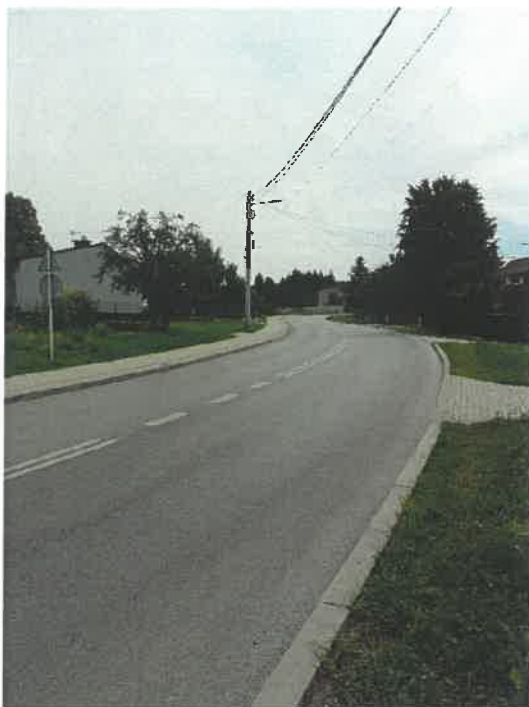
Przebudow ul. Rocha etap I