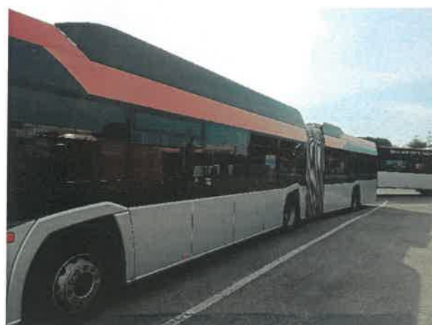
Autobus Urbino 18 nr 111 RZ125EX