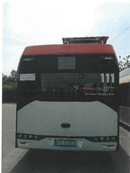
Autobus Urbino 18 nr 111 RZ125EX