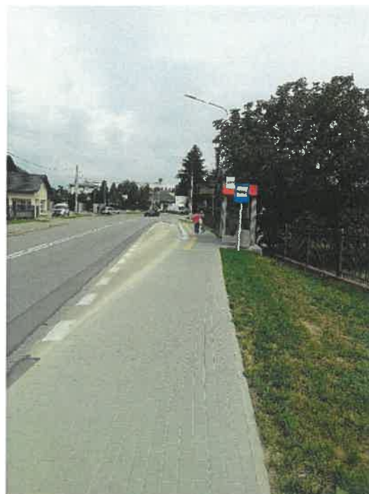
Wiata i zatoka ul. Witolda Seminarium 01