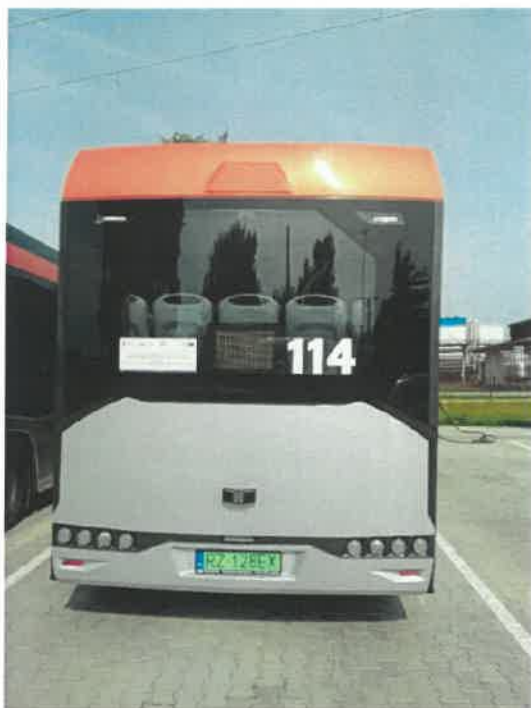
Autobus Urbino 9LE nr 114 RZ128EX