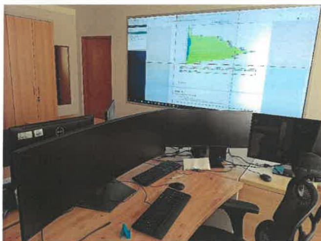
System ITS umożliwiający klasyfikację rodzajową pojazdów kołowych oraz detekcję automatyczną dla pieszych i rowerzystów przy ul. Targowej