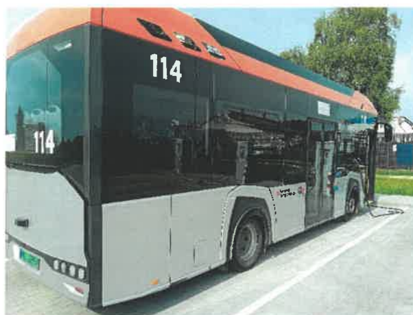
Autobus Urbino 9LE nr 114 RZ128EX