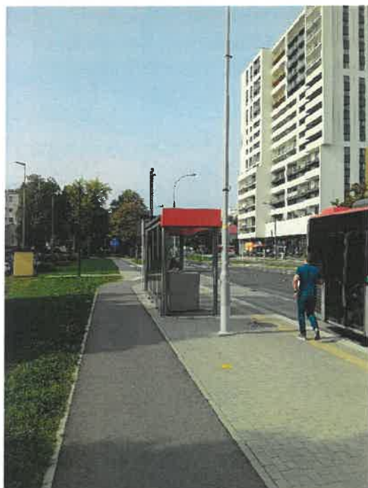
Wiata ul. Lubelska Szpital