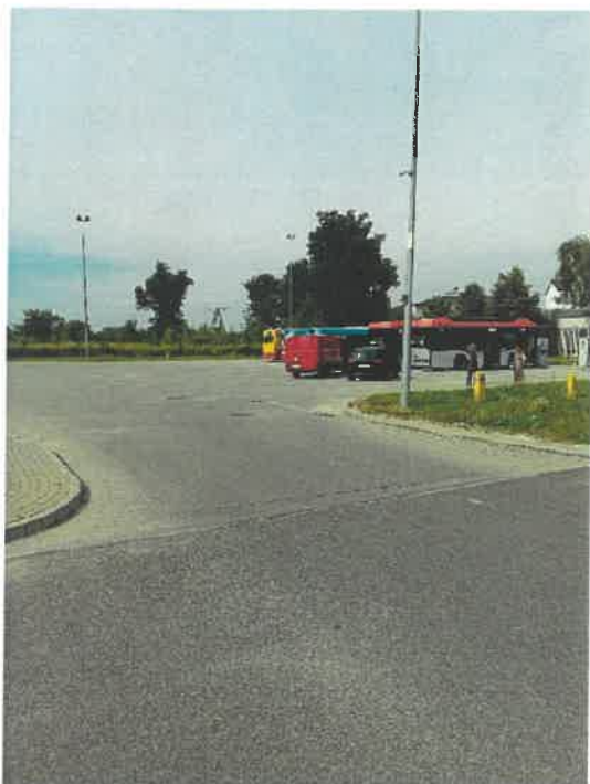
Utwardzony plac przy ul. Lubelskiej