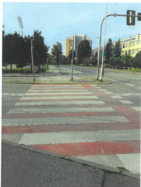
Infrastruktura rowerowa: przejazd dla rowerów przy ul. Hetmańskiej