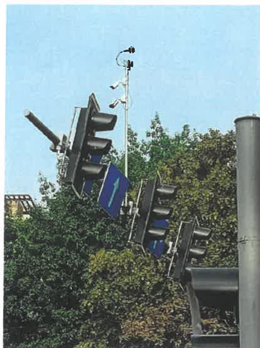
System ITS umożliwiający klasyfikację rodzajową pojazdów kołowych oraz detekcję automatyczną dla pieszych i rowerzystów na ul. Hetmańskiej