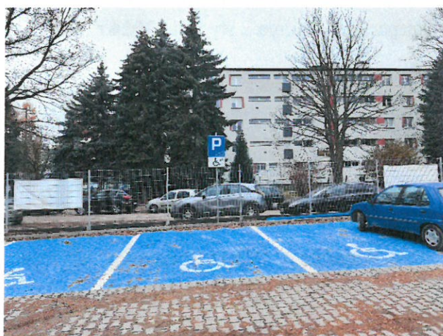
3. Miejsca postojowe dla osób niepełnosprawnych