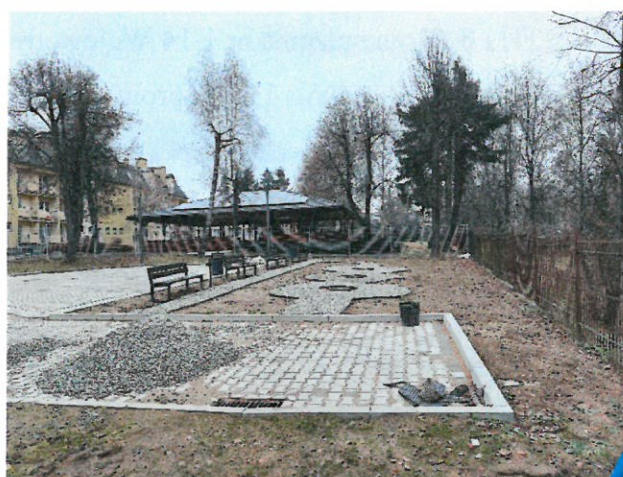
4. Ogród sensoryczny

Budynek podzielono na strefy funkcjonalne dostępne z holu wejściowego. W części mieszkalnej znajdują się 4 pokoje jednoosobowe z łazienkami dla osób niepełnosprawnych oraz pokój medyczny i aneks kuchenny.