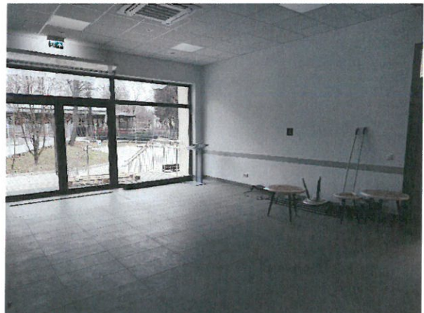
9. Przestrzeń wypoczynkowa