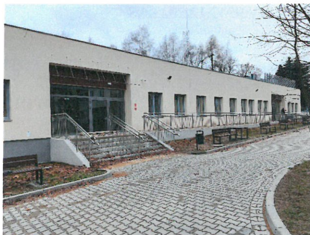
2. Elewacja północna