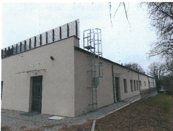
1. Elewacja południowa

Teren wokół Centrum jest ogrodzony, ciągi piesze, pieszo-jezdne i jezdne zostały utwardzone kostką betonową, zamontowano ławki, stoły zewnętrzne oraz kosze na śmieci. Przy Centrum utworzono i oznaczono miejsca postojowe, w tym miejsca dla osób niepełnosprawnych. Wykonano również ogród sensoryczny.