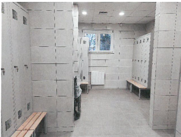
10. Szatnia z wózkownią