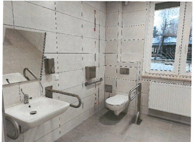
6. Łazienki w pokojach jednoosobowych