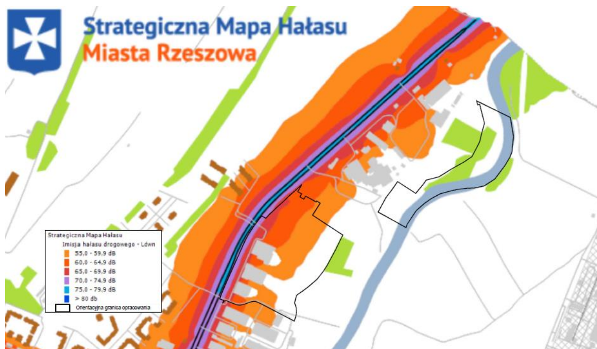
Rys. Strategiczna mapa hałasu Ldwn dla obszaru objętego mpzp nr 324/5/2021 – II „Dolina Wisłoka” w Rzeszowie

Dla zobrazowania powyższego zagadnienia wykorzystano strategiczną mapę hałasu miasta Rzeszowa z 2022 r. Wynika z niej, że część terenu narażona jest na poziom hałasu powyżej 65dB. Przeznaczenie terenów dla funkcji usługowej nie wymaga ich ochrony akustycznej.