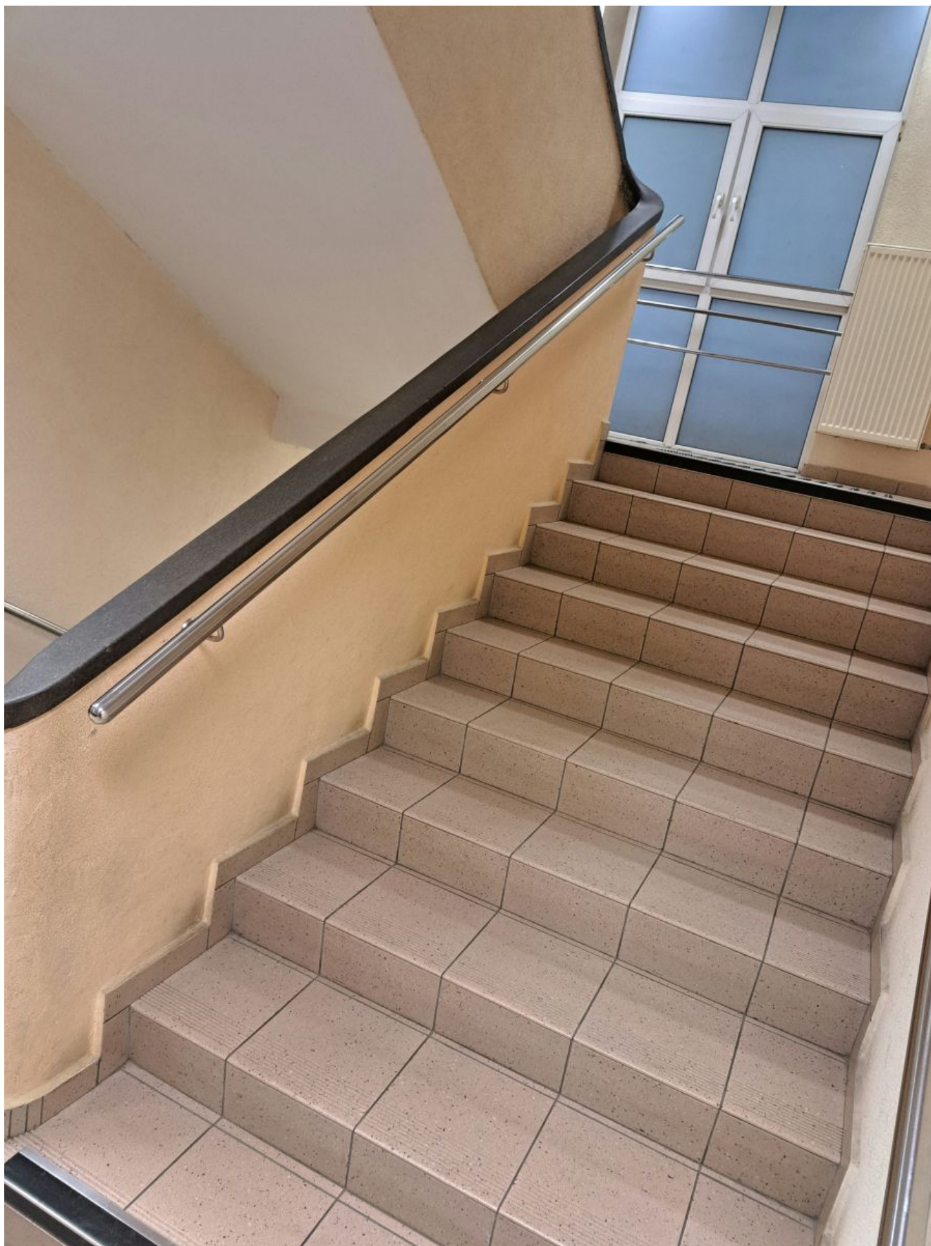
Wejście do budynku Urzędu Miasta Rzeszowa przy ul. Kopernika 15