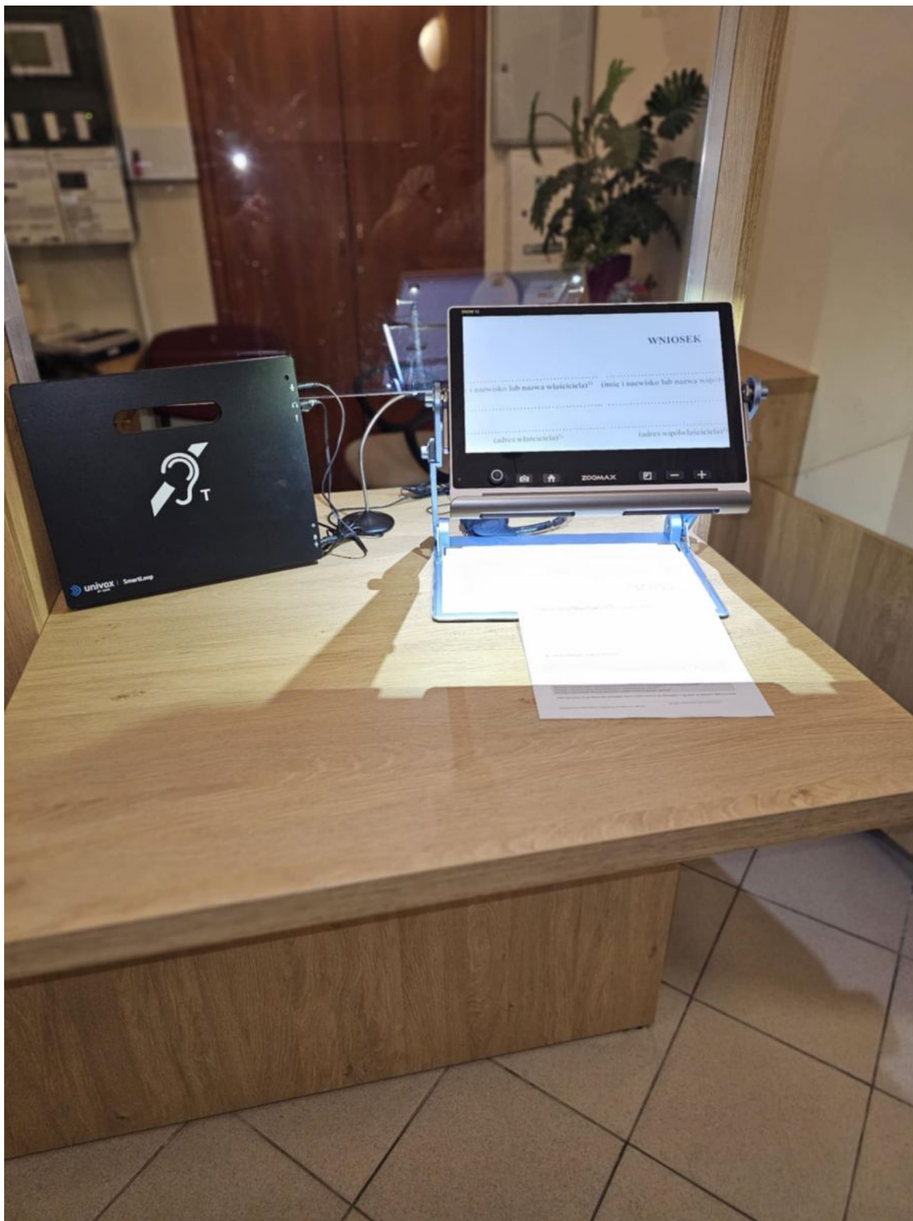
Punkt Informacyjny Urzędu Miasta Rzeszowa przy ul. Ofiar Getta 7