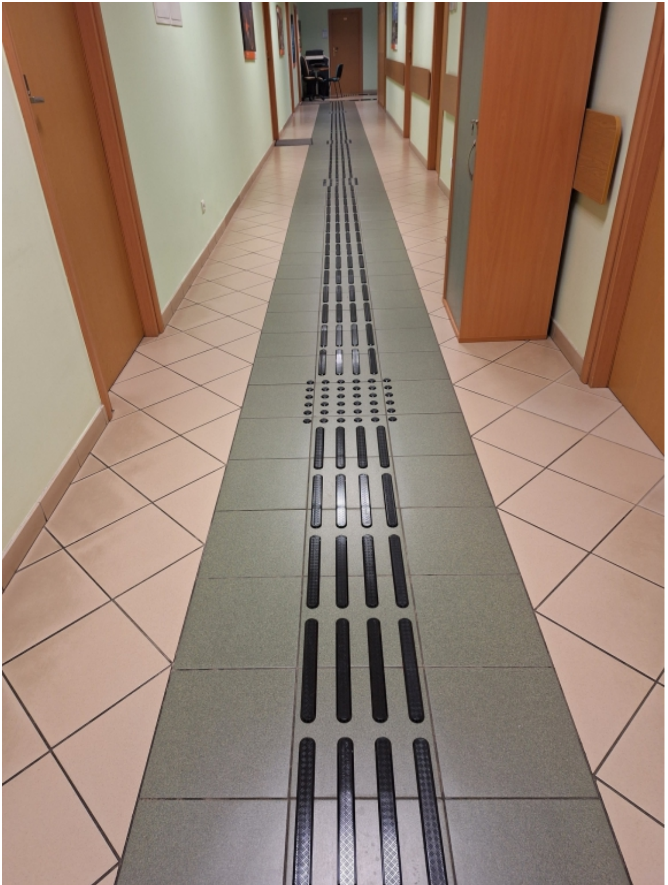
Korytarz budynku Urzędu Miasta Rzeszowa przy ul. Okrzei 1