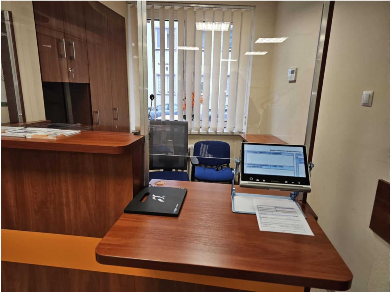
Punkt Informacyjny Urzędu Miasta Rzeszowa przy ul. Kopernika 15