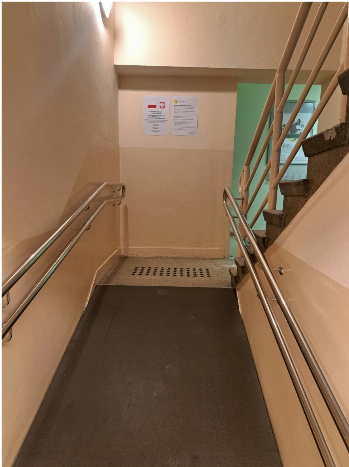
Wejście do budynku Urzędu Miasta Rzeszowa przy ul. Okrzei 1