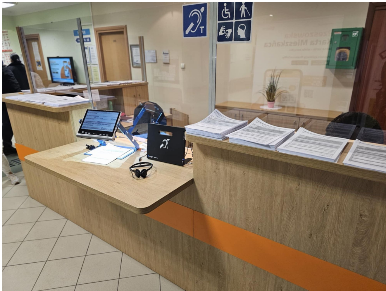
Punkt Informacyjny Urzędu Miasta Rzeszowa przy ul. Okrzei 1