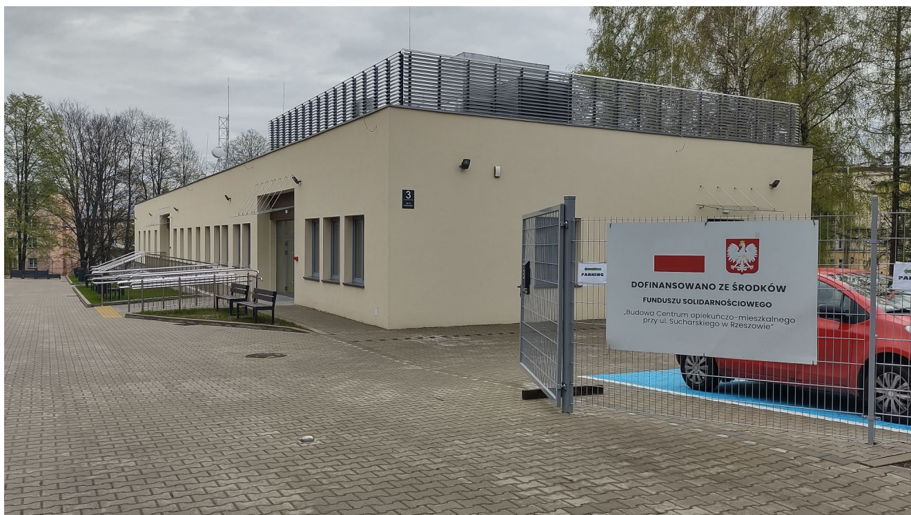
Budynek Centrum opiekuńczo-mieszkalnego przy ul. Sucharskiego w Rzeszowie

Zakres rzeczowy zadania pn.: „Budowa Centrum opiekuńczo-mieszkalnego przy ul. Sucharskiego w Rzeszowie” obejmował budowę budynku użyteczności publicznej, parterowego, jednokondygnacyjnego wraz z jego wyposażeniem oraz utworzeniem terenu rekreacyjno – wypoczynkowego z ogrodem sensorycznym. Centrum przeznaczone jest dla osób niepełnosprawnych ze znacznym lub umiarkowanym stopniem niepełnosprawności, w tym dla 4 osób z możliwością okresowego pobytu całodobowego oraz dla 16 osób z możliwością pobytu dziennego. Obiekt jest w pełni dostępny architektonicznie. Teren wokół budynku został dostosowany do potrzeb osób niepełnosprawnych, wyposażony w elementy małej architektury: ławki, stoliki oraz elementy ogrodu sensorycznego. W Centrum opiekuńczo-mieszkalnym świadczone jest różnorodne wsparcie w zakresie potrzeb zdrowotnych, pielęgnacyjnych, zapobiegania wtórnym powikłaniom, stymulowania i rozwijania sprawności ruchowej, kompetencji poznawczych oraz społecznych. W Centrum utworzono salę terapii muzycznej, salę rehabilitacji ruchowej oraz pracownię rozwoju manualnego, które służą do zapewnienia aktywnego pobytu w Centrum oraz jak najdłuższego utrzymania sprawności, aktywności i samodzielności uczestników.