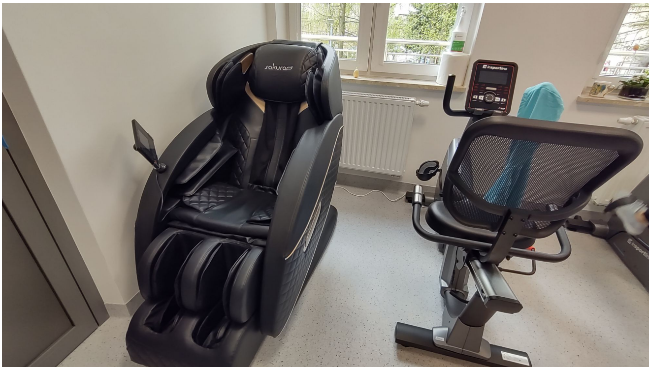
Sala rehabilitacji Centrum opiekuńczo-mieszkalnego przy ul. Sucharskiego w