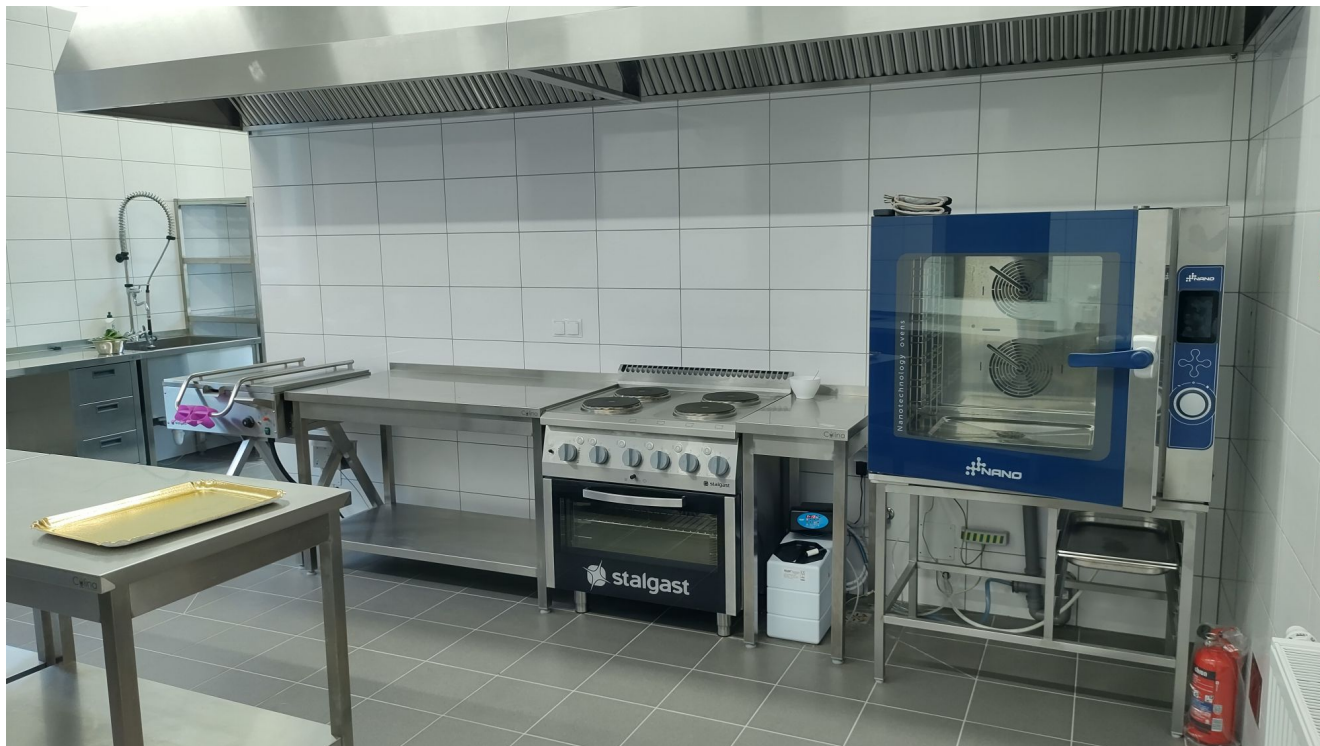
Kuchnia w Centrum opiekuńczo-mieszkalnego przy ul. Sucharskiego w Rzeszowie