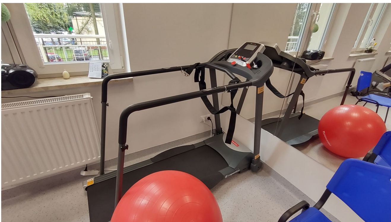
Sala rehabilitacji Centrum opiekuńczo-mieszkalnego przy ul. Sucharskiego w Rzeszowie