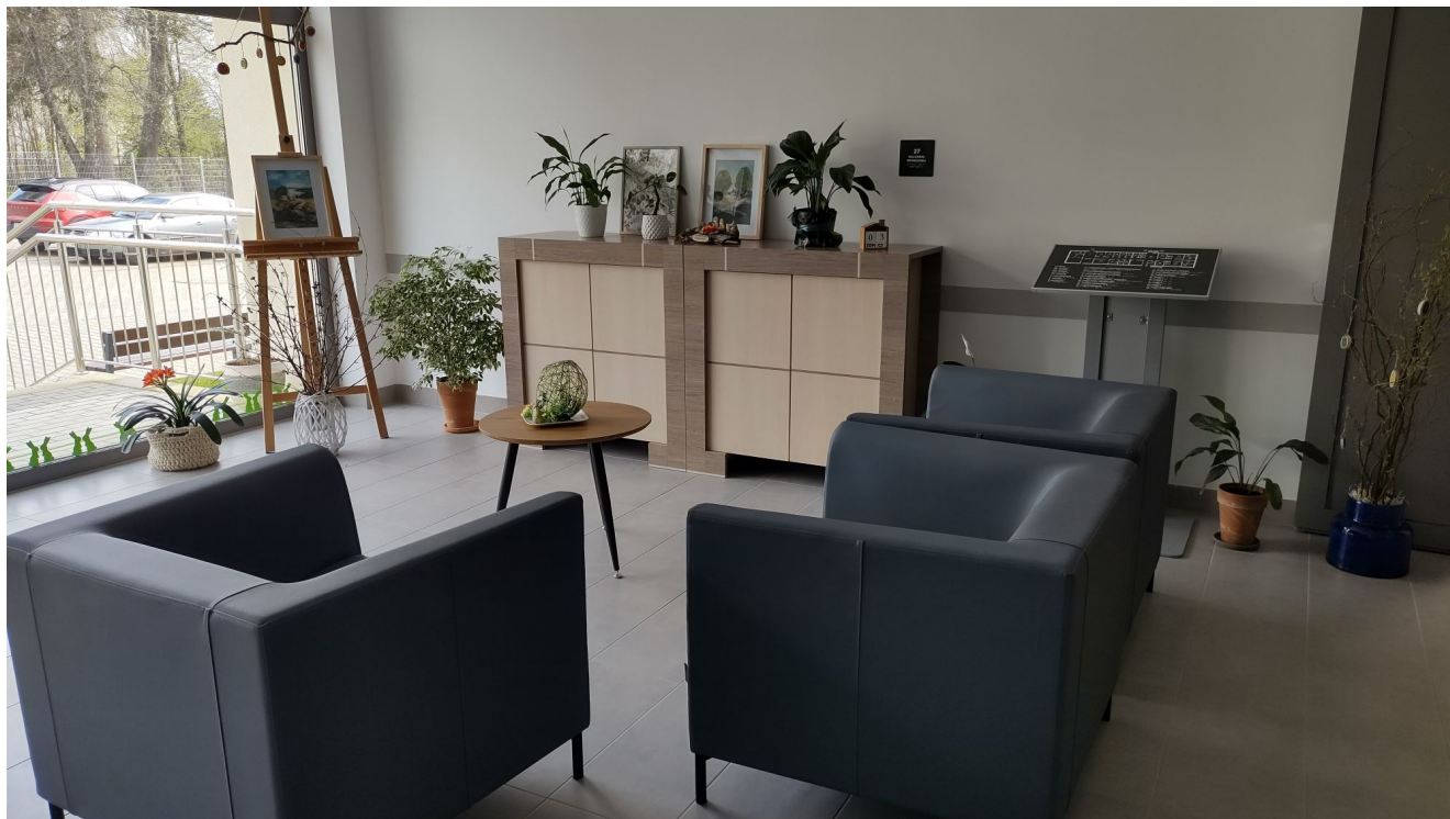
Hol wypoczynkowy Centrum opiekuńczo-mieszkalnego przy ul. Sucharskiego w Rzeszowie