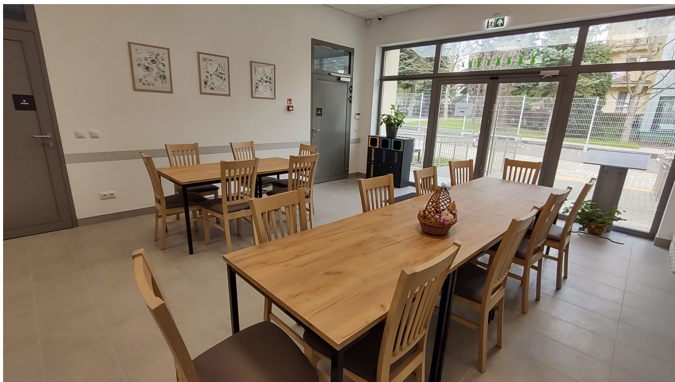
Jadalnia w Centrum opiekuńczo-mieszkalnym przy ul. Sucharskiego w Rzeszowie