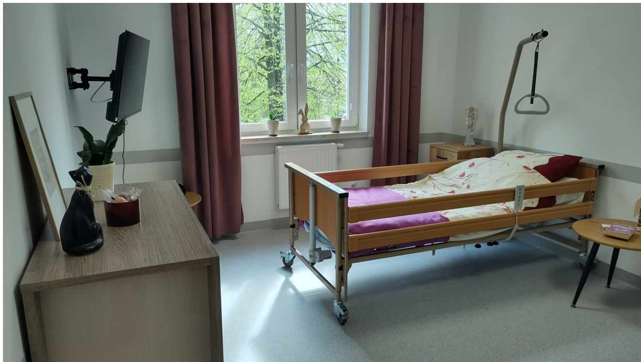
Pokój jednoosobowy w Centrum opiekuńczo-mieszkalnym przy ul. Sucharskiego w Rzeszowie