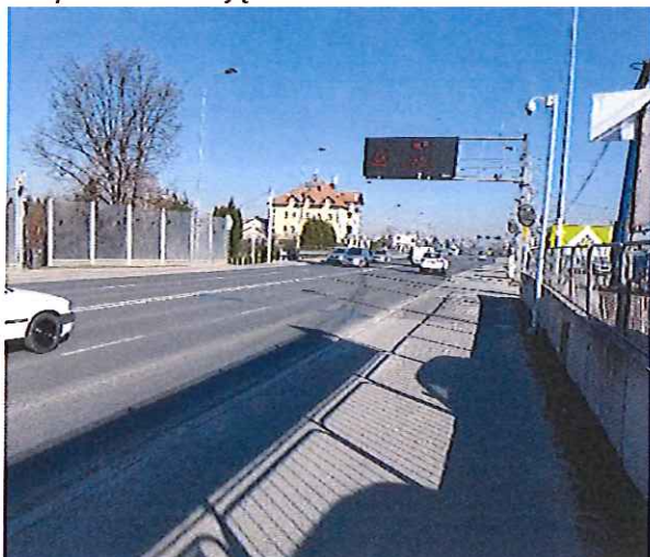
System dynamicznego ważenia pojazdów – waga preselekcyjna ul. Sikorskiego