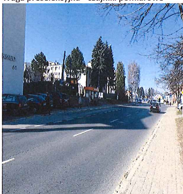
Zatoka i wiata ul. Langiewicza