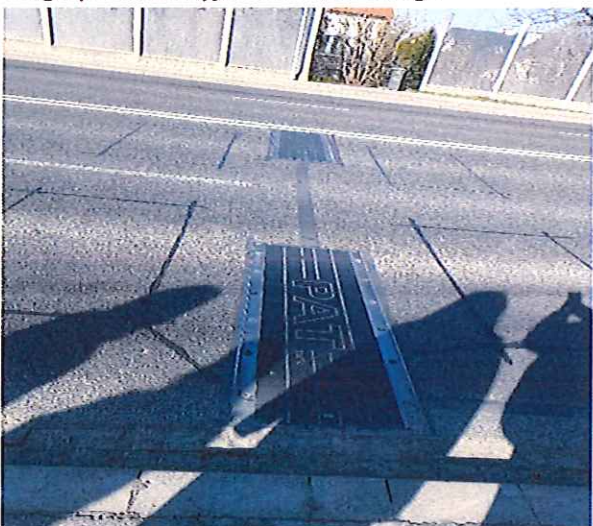
Waga preselekcyjna - czujniki pomiarowe