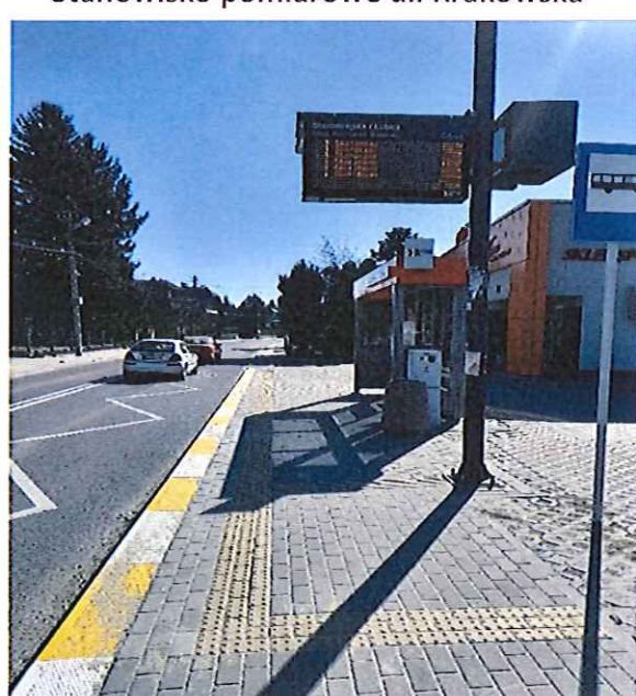
Zatoka ul. Paderewskiego