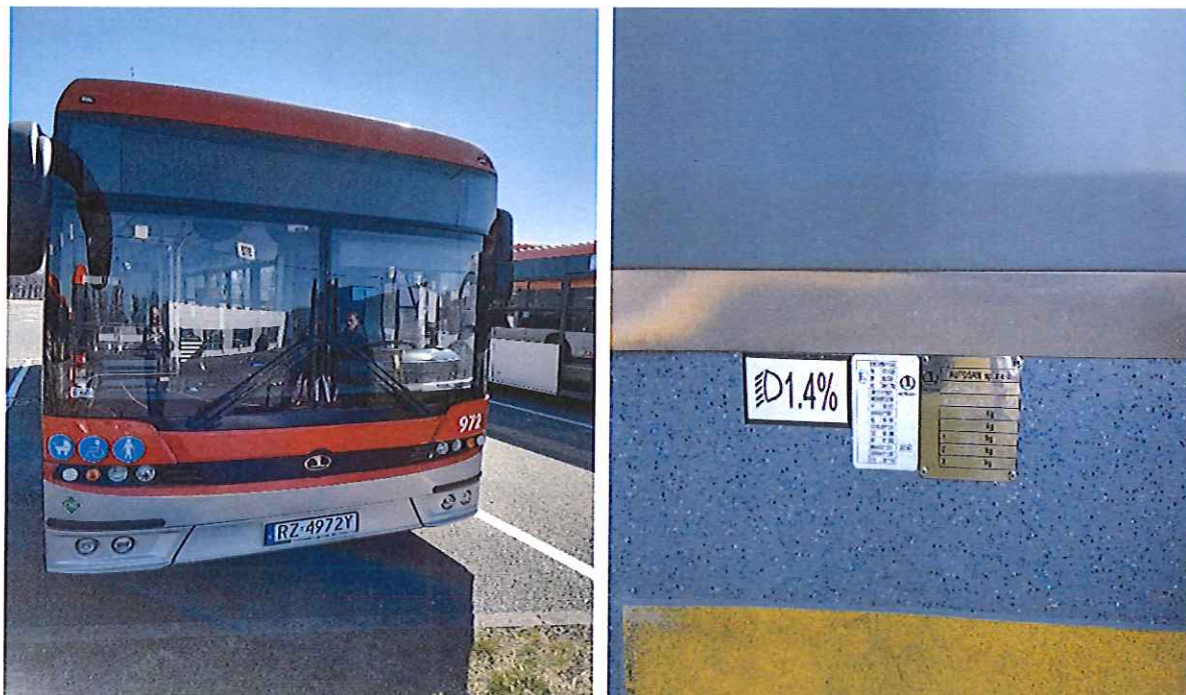
Autobus i tabliczka znamionowa