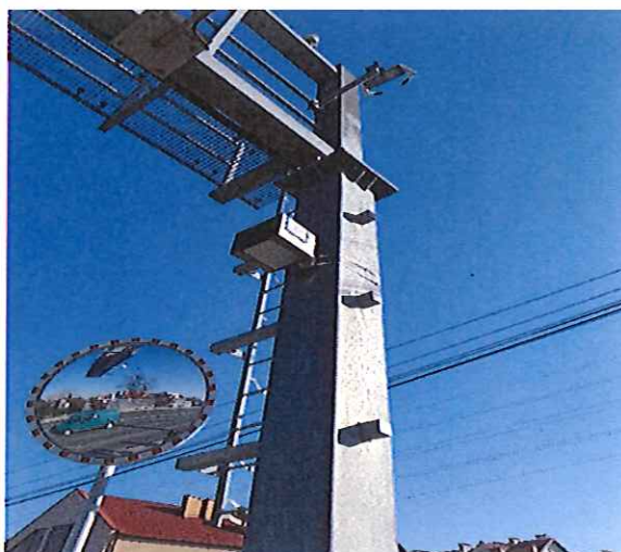
Czujnik gabarytowy i zmiany pasa